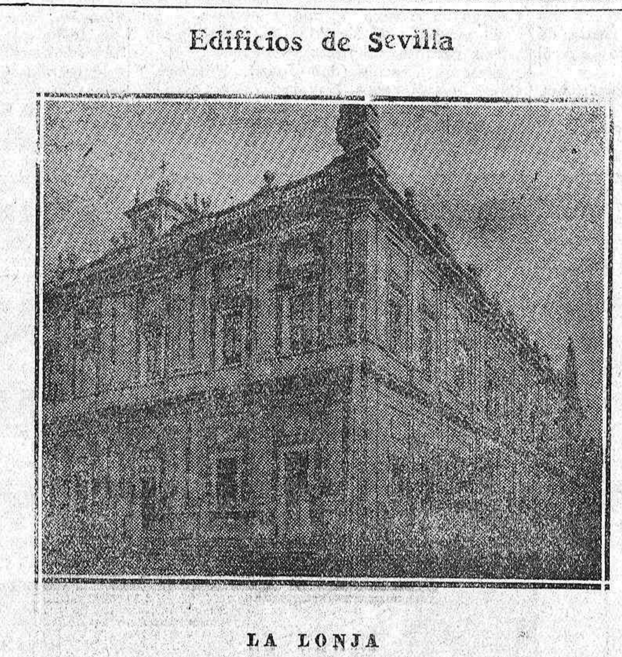
Edificios de Sevilla LA LONJA