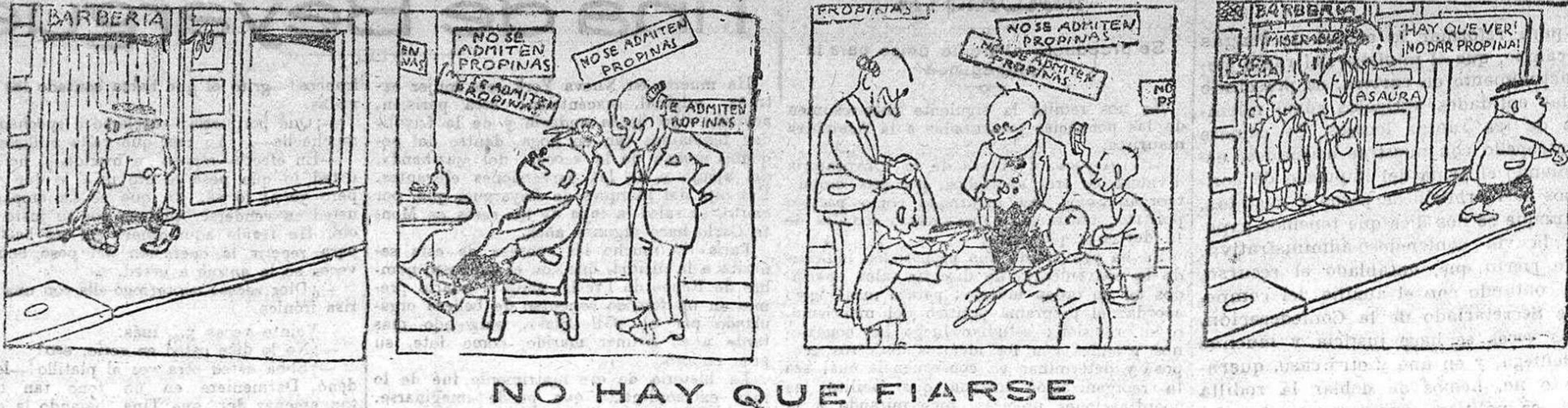
NO HAY QUE FIARSE