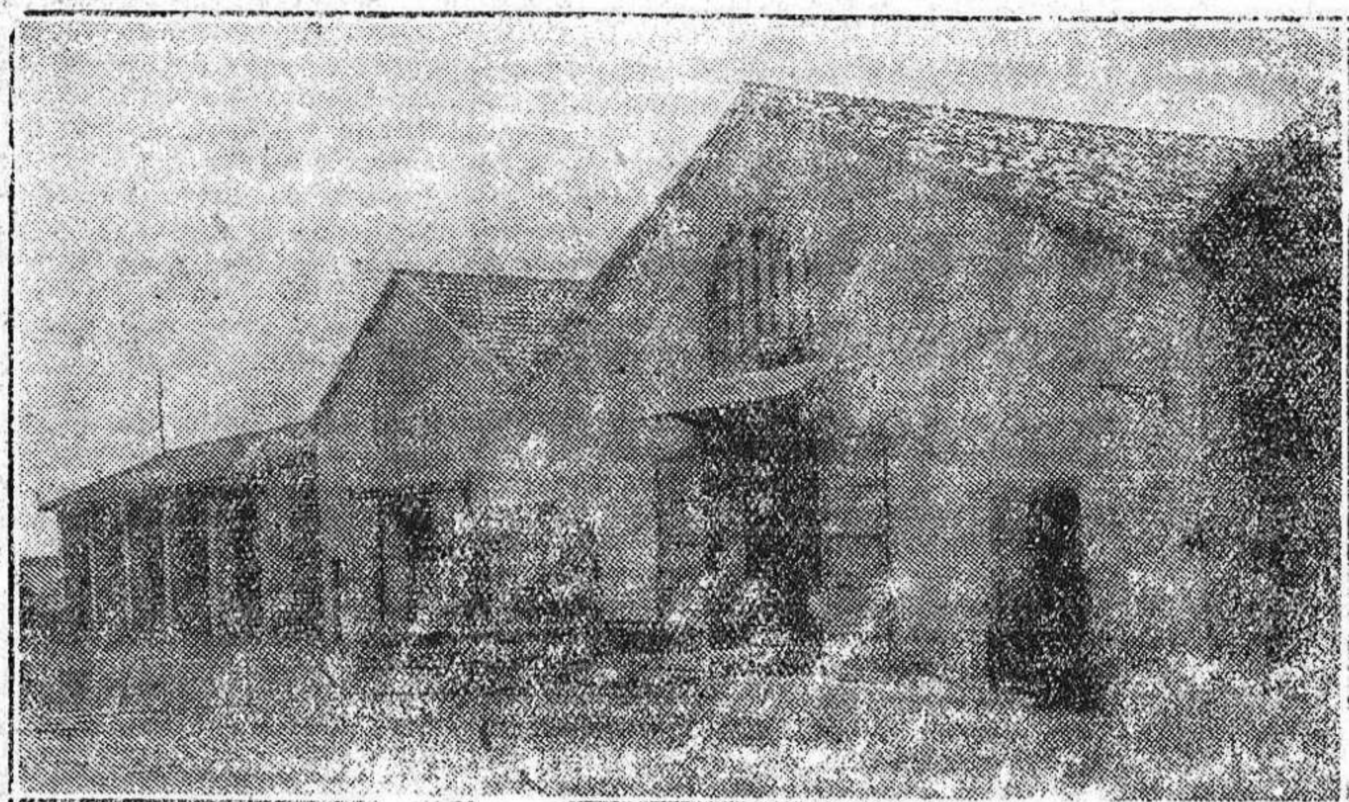
Vista paraf de los almacenes de maderas de Zaragoza.

decidido a seguir el impulso natural de su negocio, proyecta darle gran amplitud, construyendo nuevas y grandes naves en los terrenos enclavados en la fábrica, lo que podrá realizar fácilmente, por ser de su propiedad dichos terrenos, y con ello don Mariano Menor conseguirá poseer una gran fábrica, dotada de todos los elementos necesarios para su industria. Los numerosos productos de esta importante fábrica, sus amables y finos champagnes, el ron de diferentes licores de su fábrica,