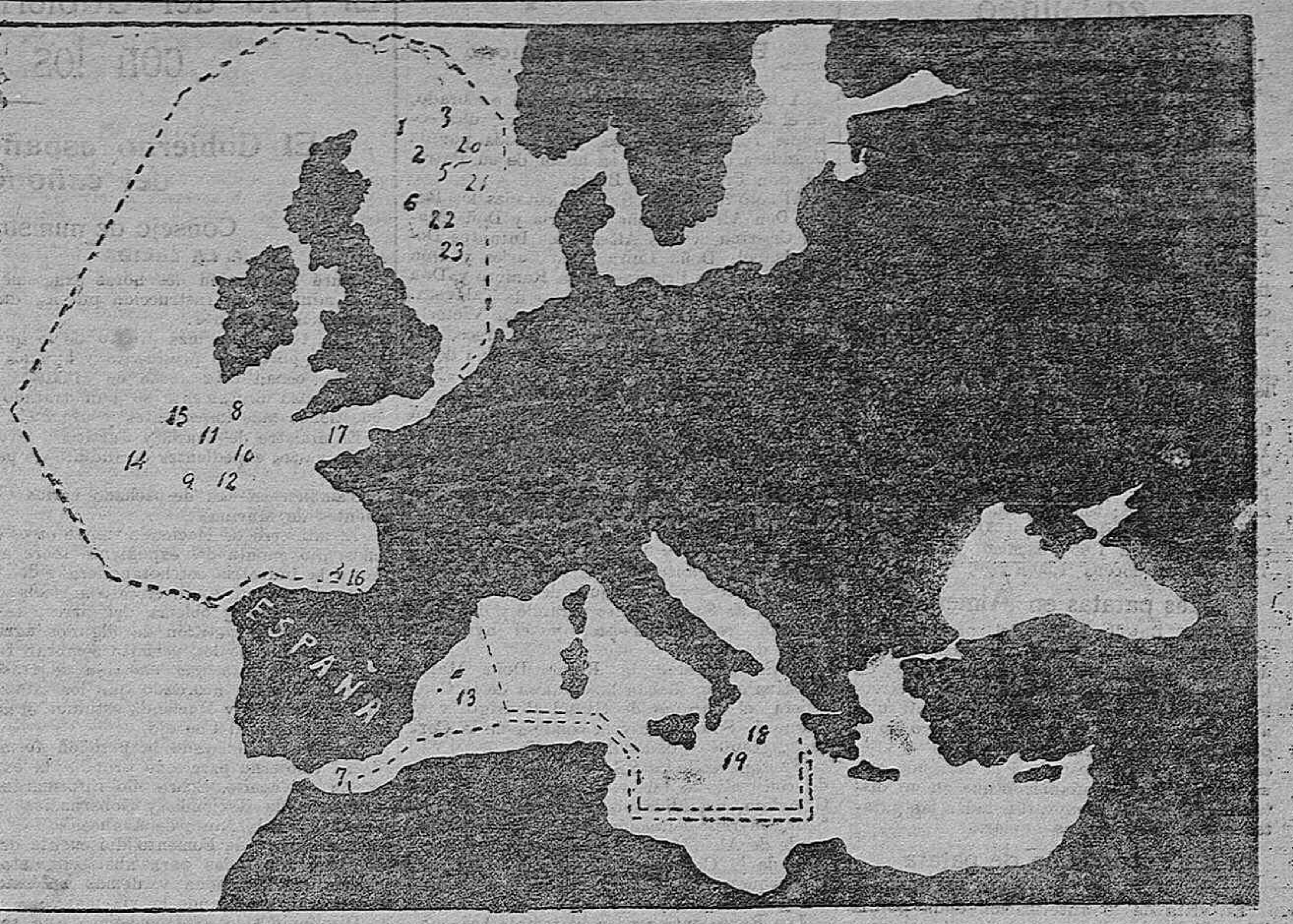
49 BUQUES HUNDIDOS POR LOS SUBMARINOS ALEMANES DURANTE LOS ÚLTIMOS CINCO DIAS