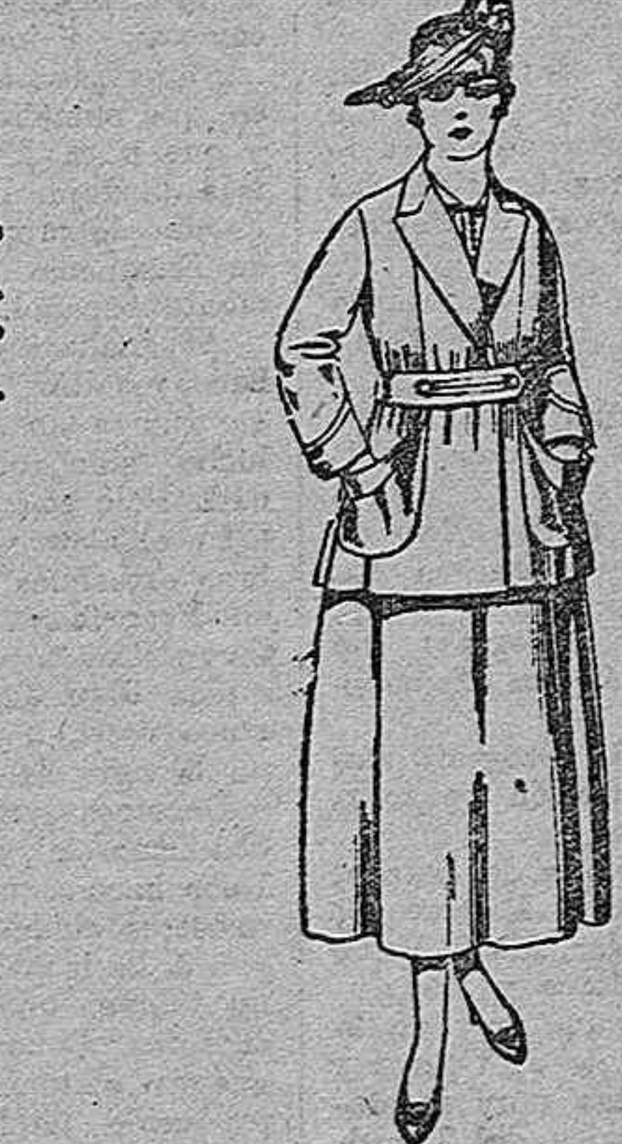
Trajes de lanilla, negra, azul y color. De ptas. 70 a 75.

Ropas confeccionadas para Caballero, Señora y Niños.