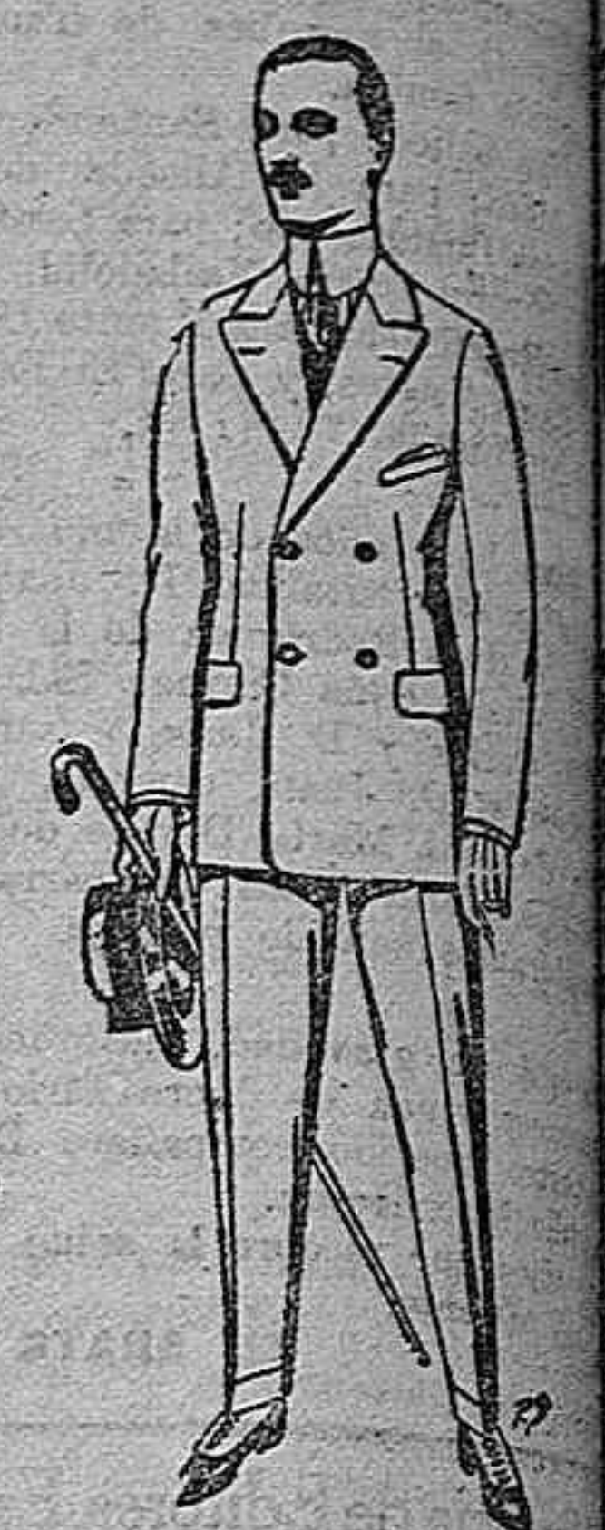
Trajes de vicuña o legueros o azules. De ptas. 38 a 40. Los mismos en melón a 40 pesetas de novedad. De ptas. 38 a 40.