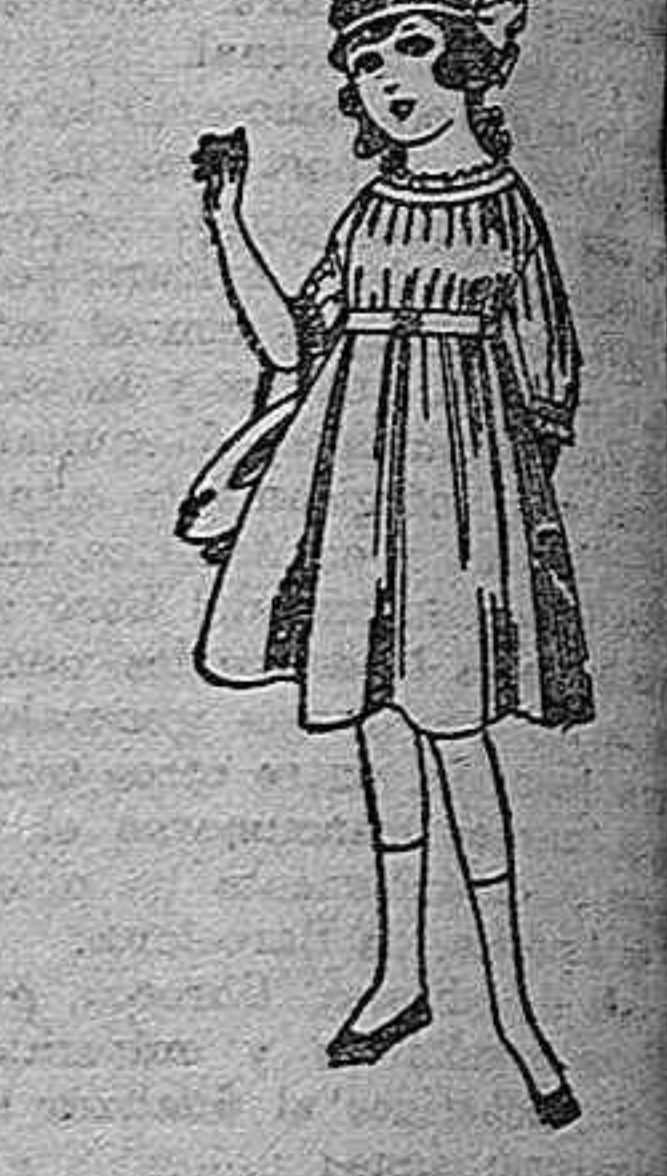
Vestidos de lanilla azul, para niñas de 4 a 9 años. De ptas. 22 a 24. Los mismos en violeta. De ptas. 10 a 12.

Camisería, Géneros de punto, Carbatería, Guantería, Sombrerería, Zapatería, Paraguas, Bastones y Artículos de Viaje.