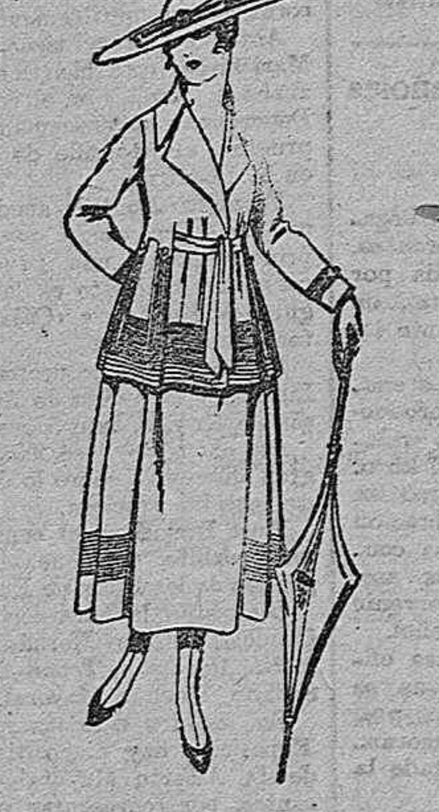
Trajes de lanilla, negra, azul y color. De ptas. 85 a 90.