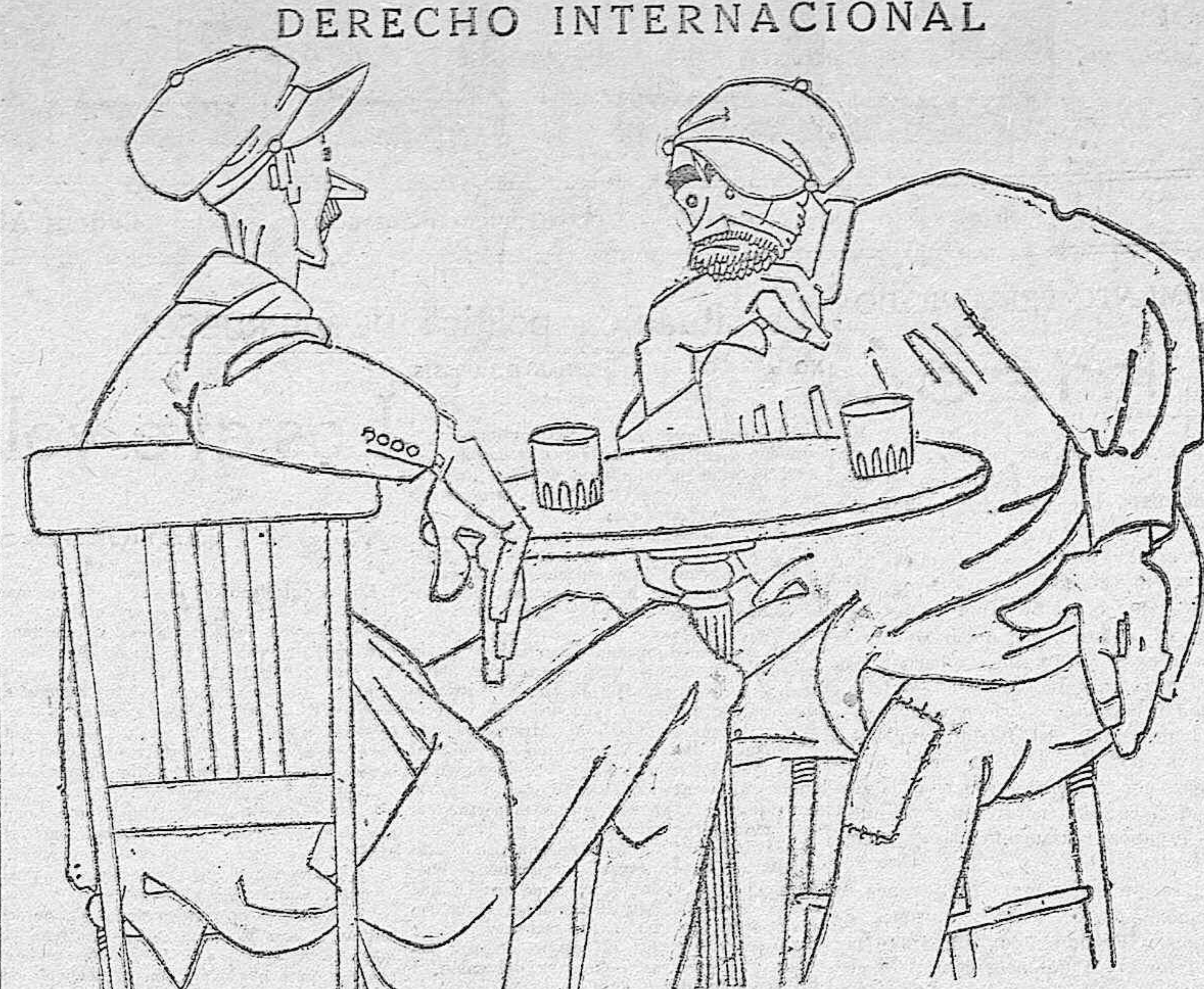
—¿Te acuerdas de «El Morcilla»? Pues mató a su suegra y se fué al Congo. —¿Le echarán mano? —Chico, no sé. Como la interfecta era su mamá política parece que se considera como un crimen político.