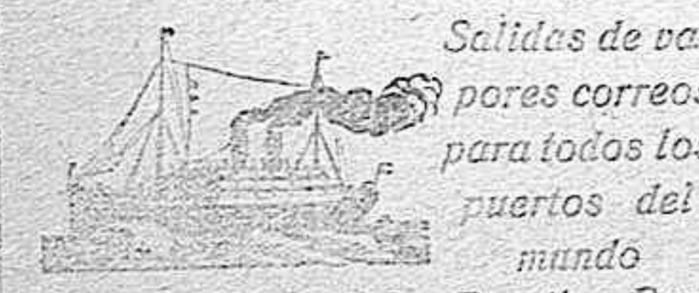
Linea de Montevideo, Brasil y Buenos Aires

Por orden del gobernador de Barcelona se ha enviado a cada una de las Delegaciones de Policía 500 pesetas, que viene a ser el importe de las multas impuestas por denuncias de agentes a los autores de delitos contra el orden público o la moral durante el año. De estas 500 pesetas se hicieron dos lotes de 200 pesetas para repartirlas entre los agentes, y con el resto se compraron cigarrillos para los agentes e inspectores.