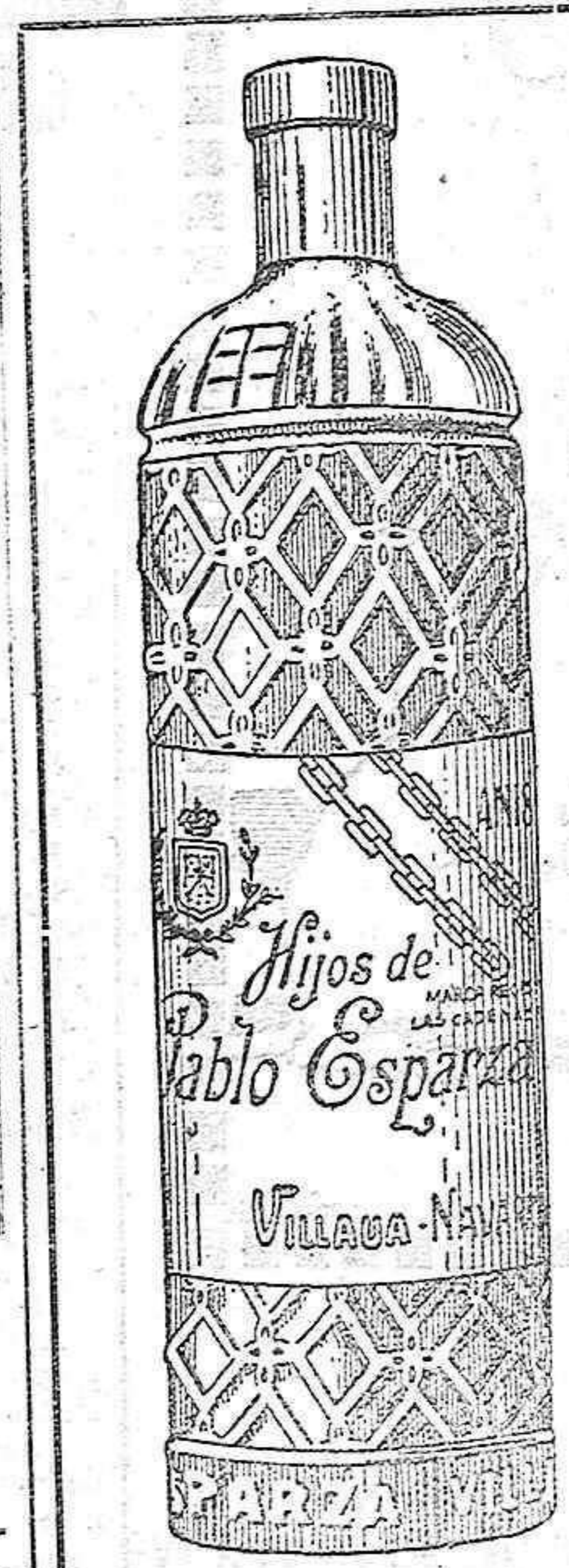
ANISADOS EXQUISITOS "Las Cadenas de Navarra" HIJOS DE PABLO ESPARZA Cosecheros y Exportadores de vinos VILLAVA (Navarra)