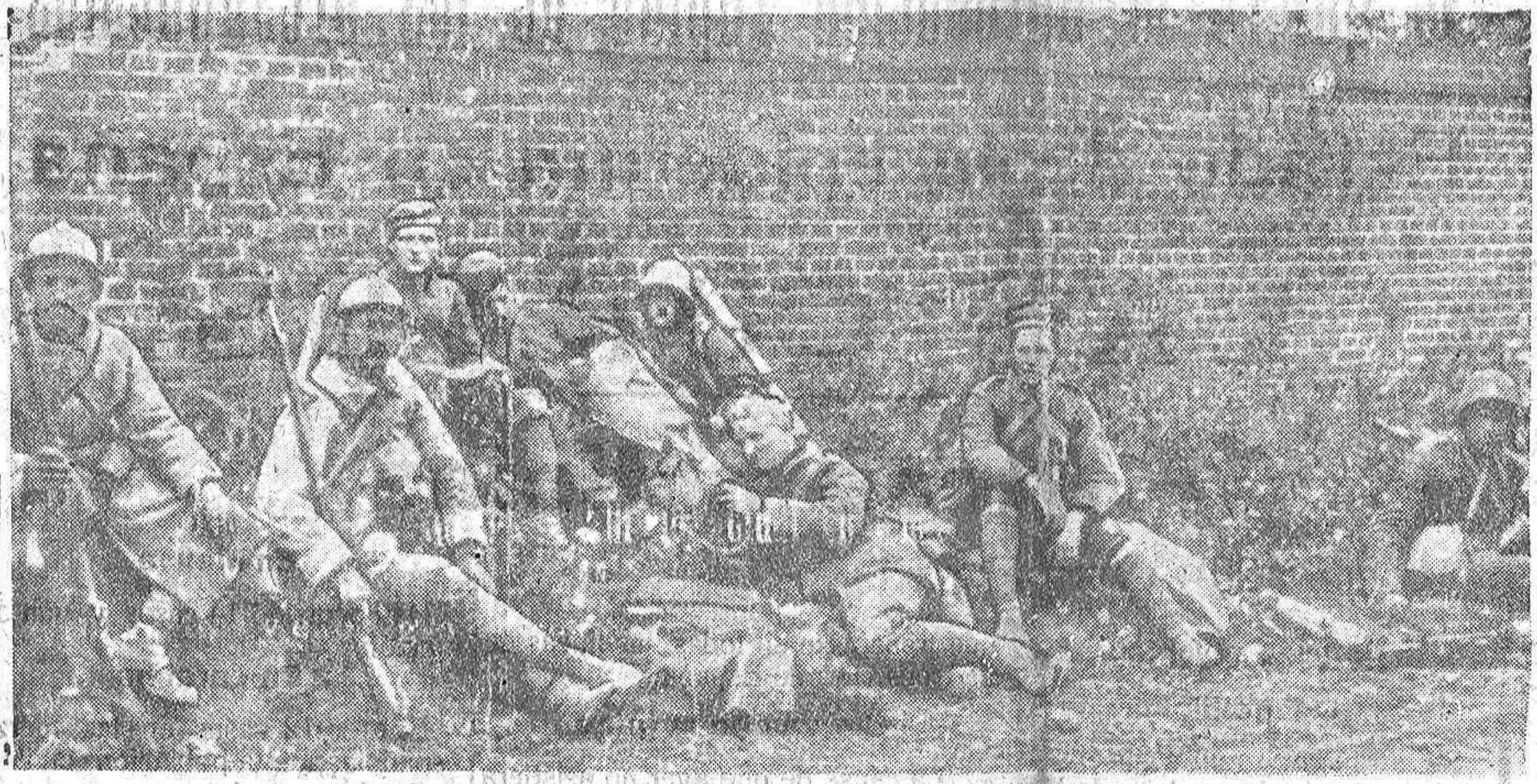
PRISIONEROS ALEMANES, DESCANSANDO