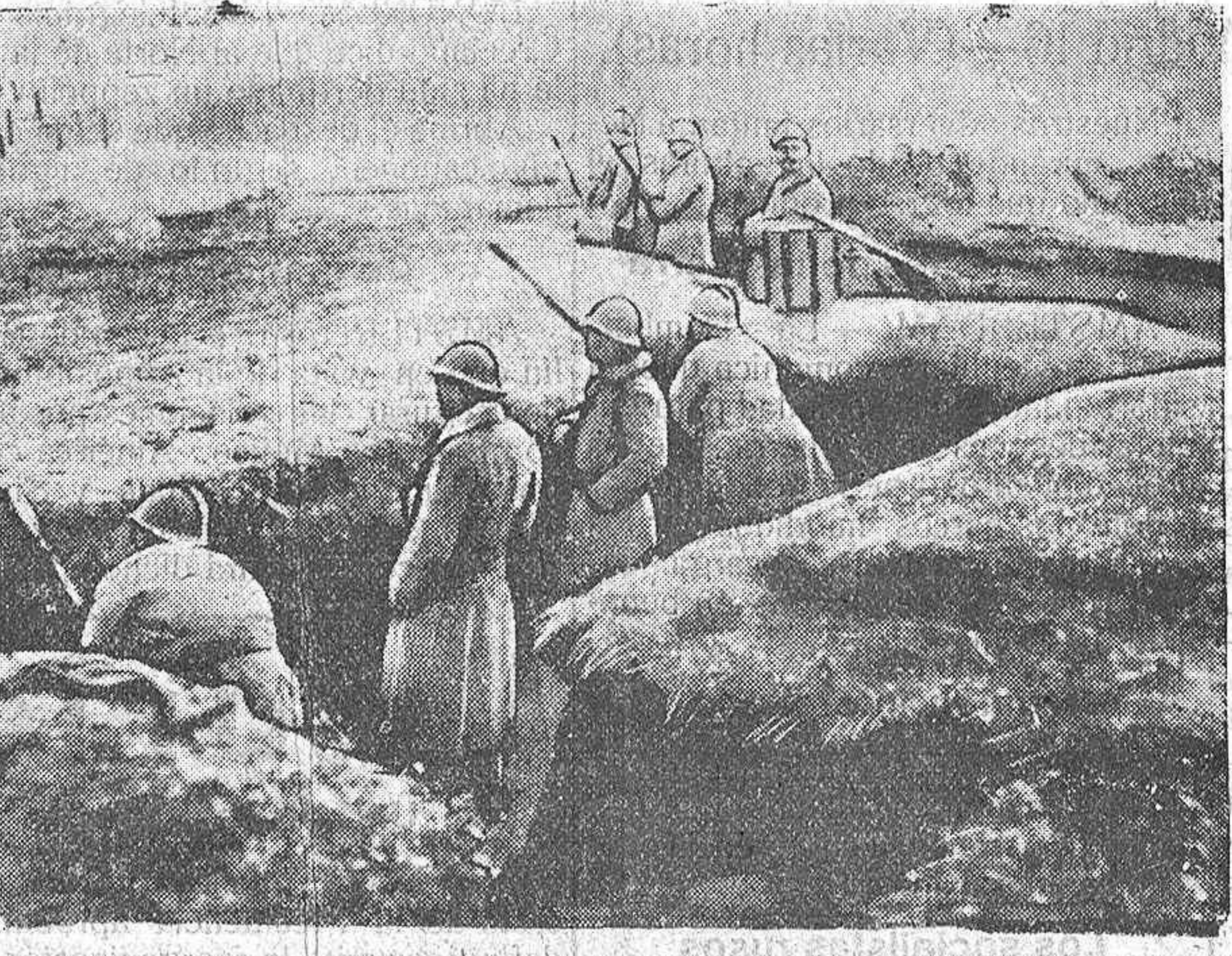
En una trinchera con el fusil lanzagranadas