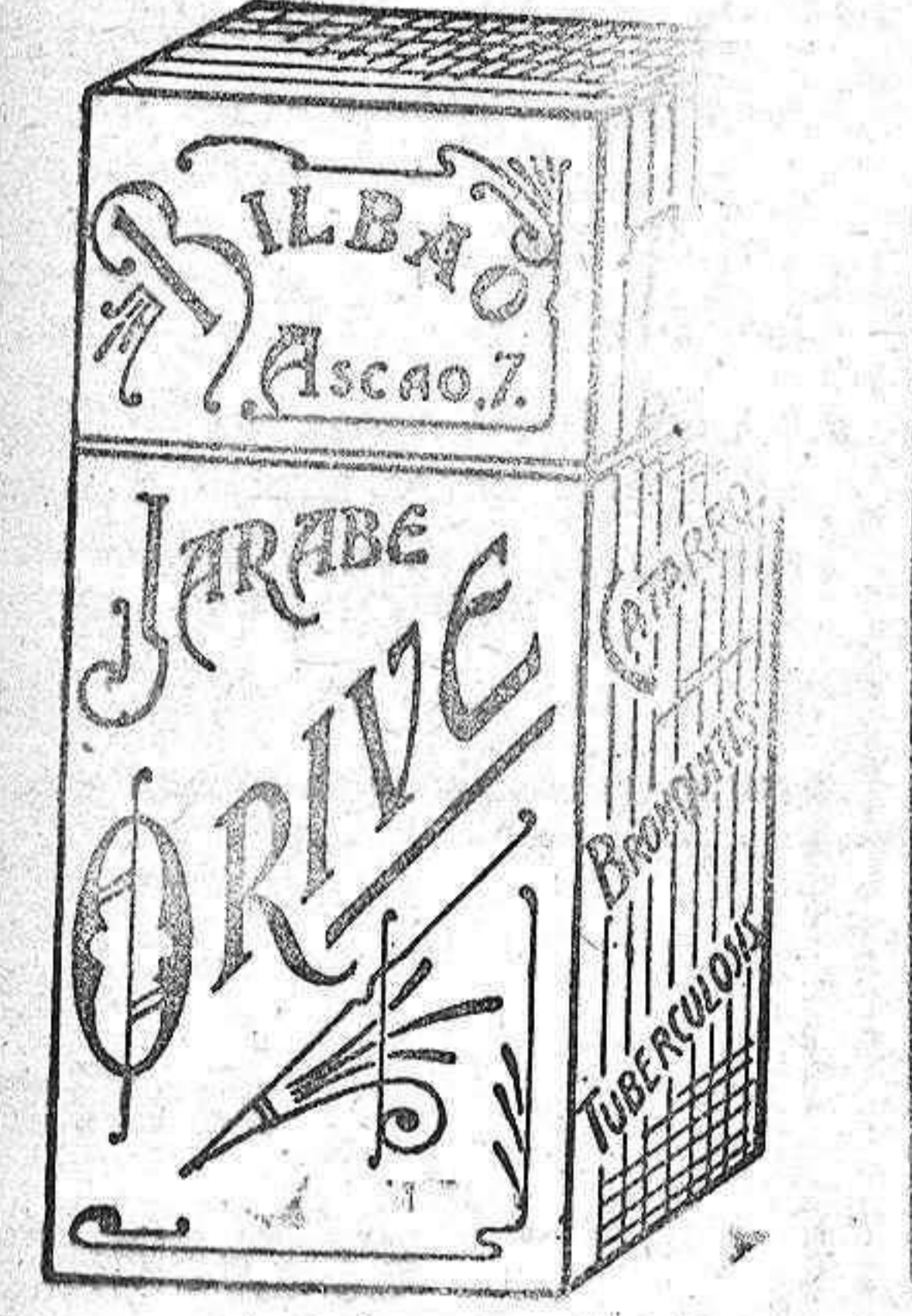
La gravedad de su mal está en esas que le cree pasajera. Curará radicalmente con Jarabe Orive.