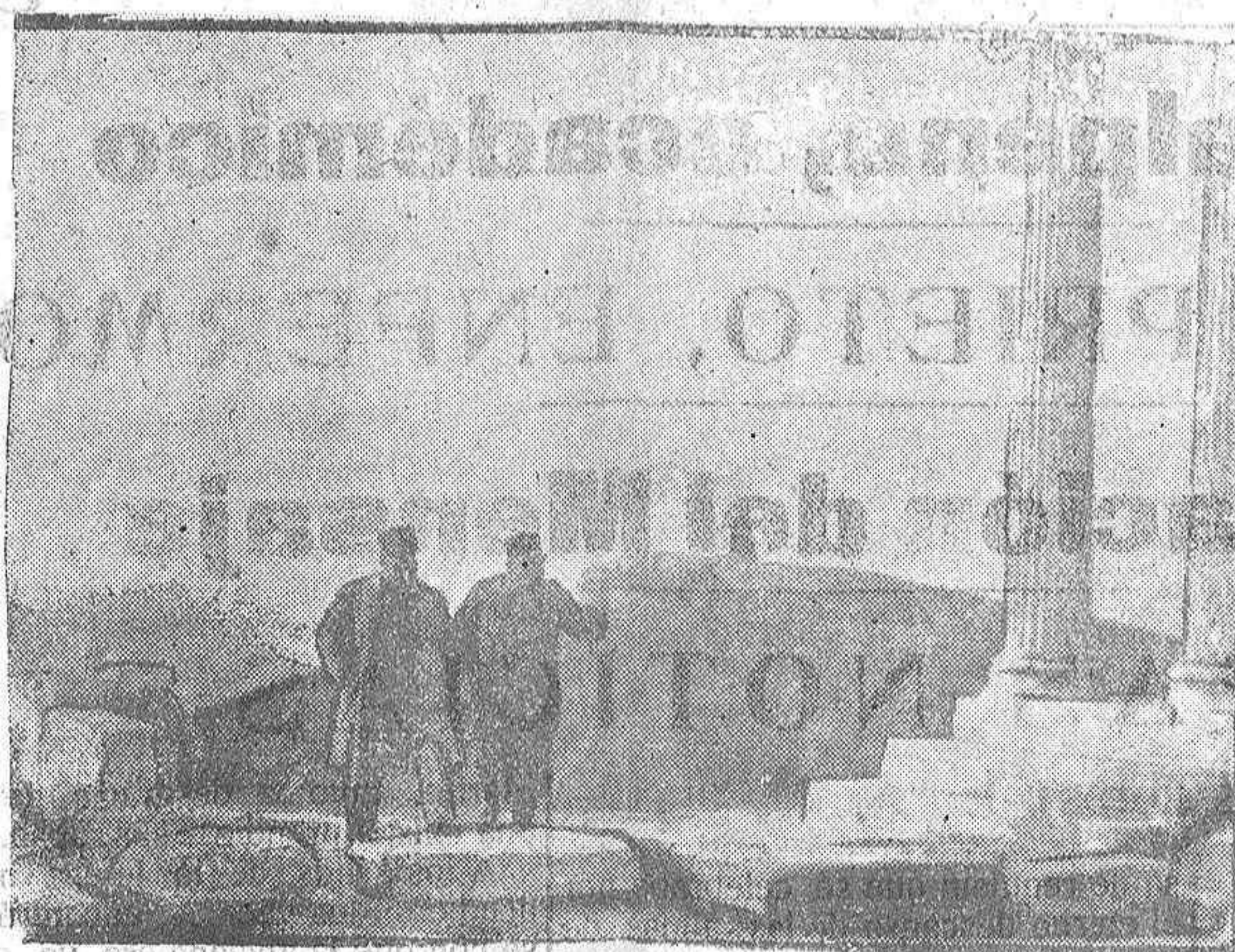
EL GENERAL GUILLAUMAT EN GRECIA.