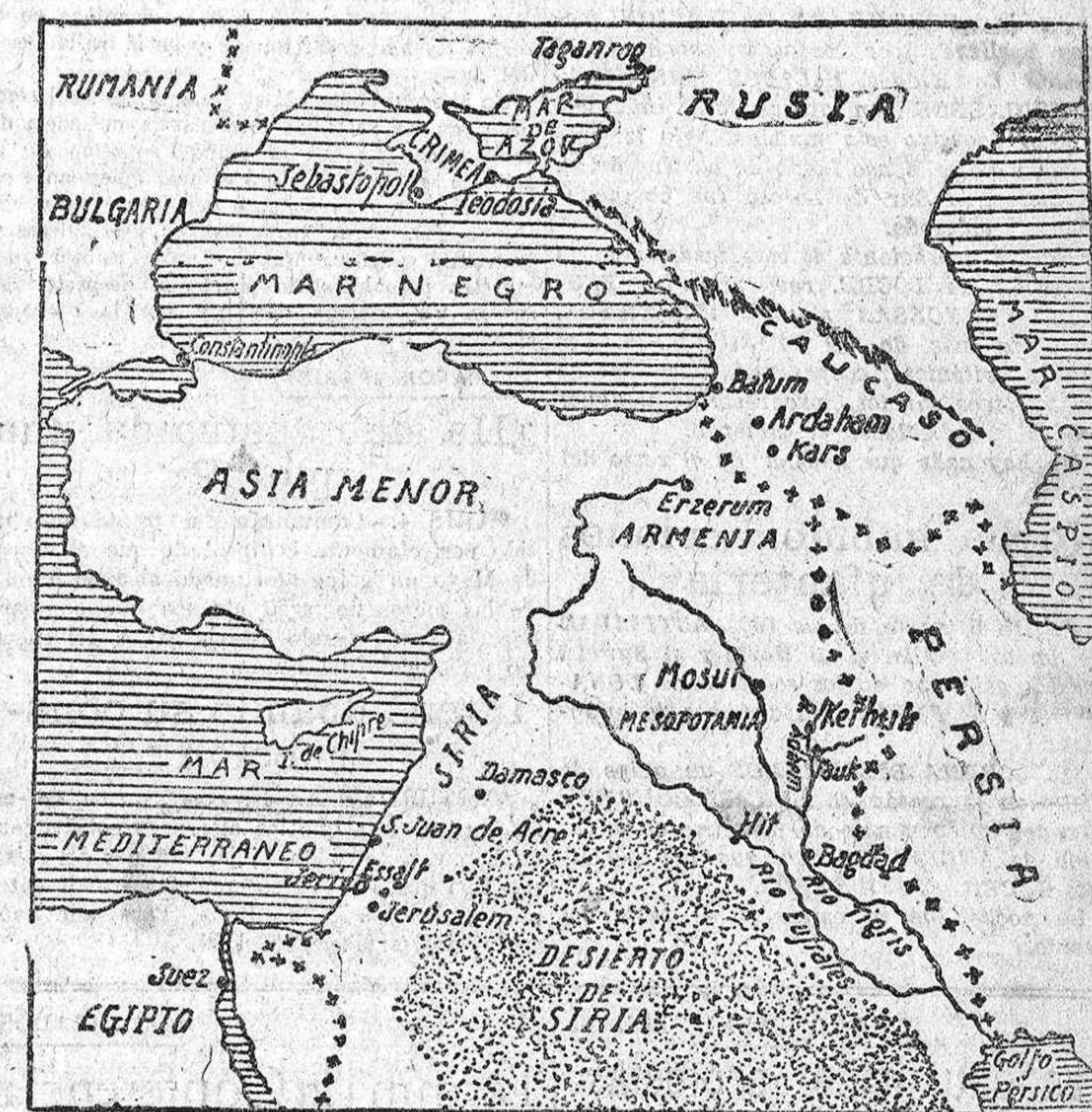
Escala 0 a los 200 Kilómetros