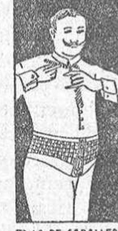
FAJA DE CABALLEÑO