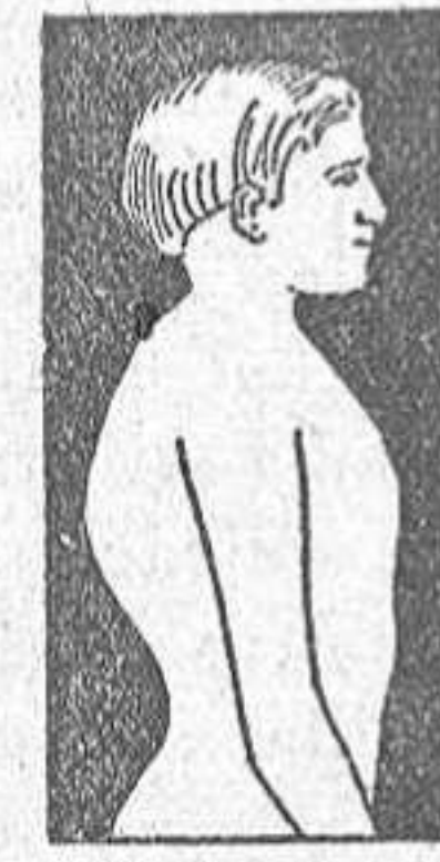
MAL DE POTT