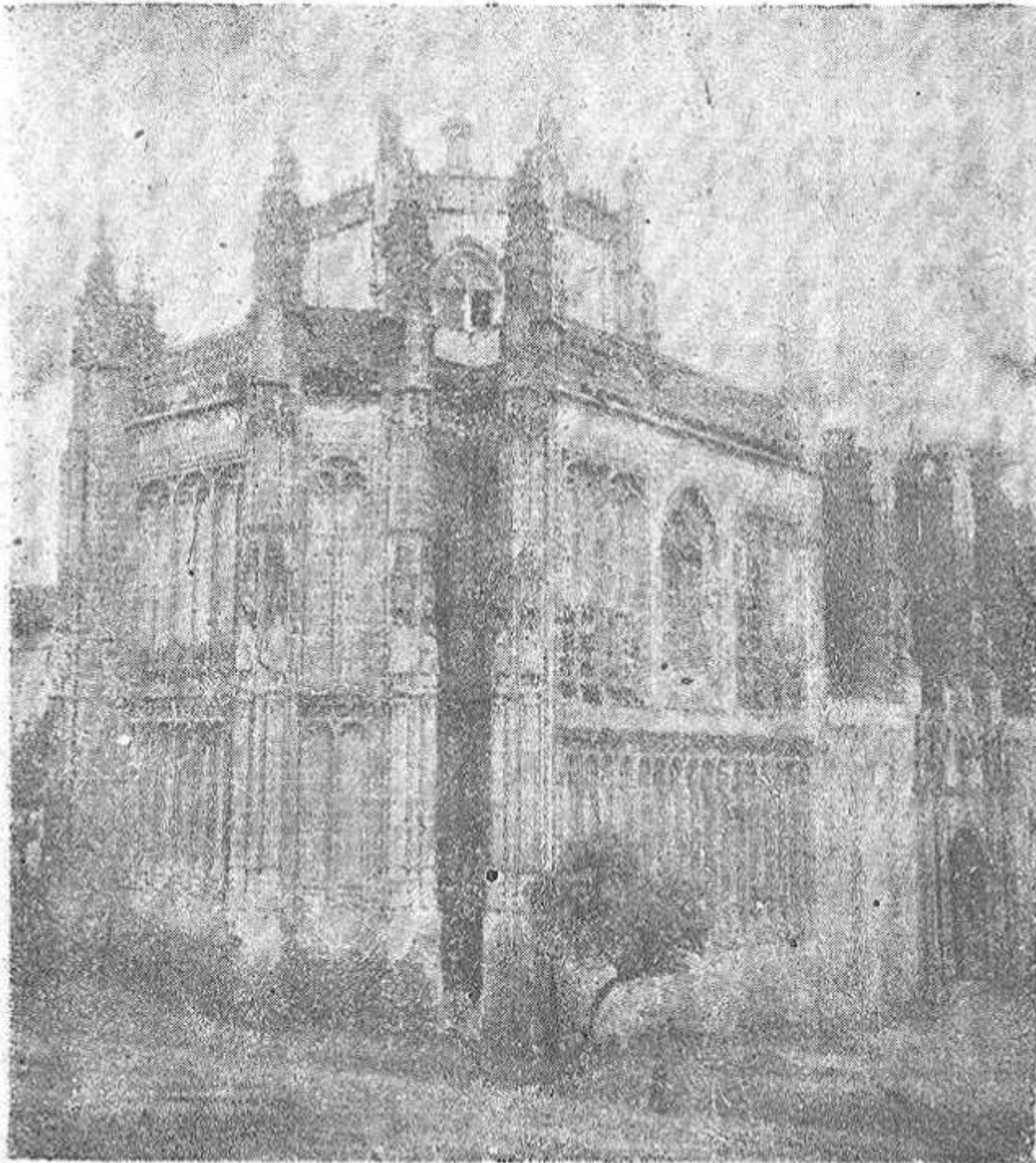
Exterior del bello monumento

Y el ilustre artista de la arquitectura consumó su obra, consi-