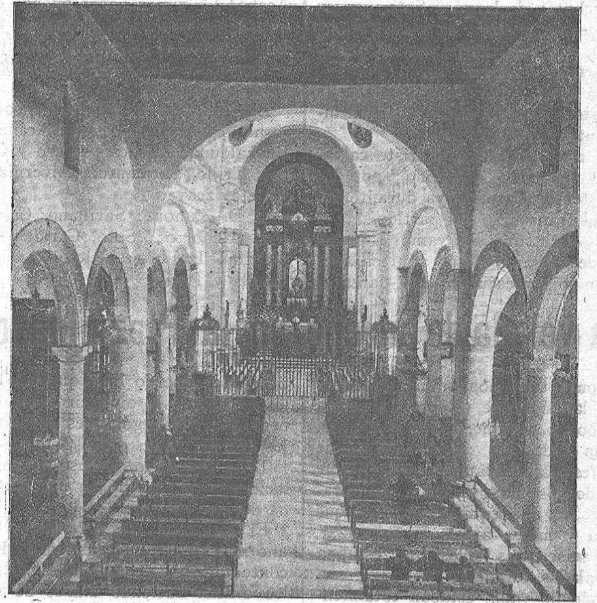
Interior de la notable Ermita del Prado

Constituye un tesoro singular y verdaderamente único, el enorme zócalo de la grandiosa iglesia, muchos millares de azulejos representando pasajes religiosos; varios retablos y frontales y especialmente la sacristía, toda también de azulejos maravillosos con algunos extraordinarios, insuperables. Verdaderamente es el mejor museo de cerámica de Talavera, conteniendo los ejemplares más interesantes de su azulejería, de aquellos espléndidos siglos XVII y XVIII, en que el arte de sus famosos artifices, de