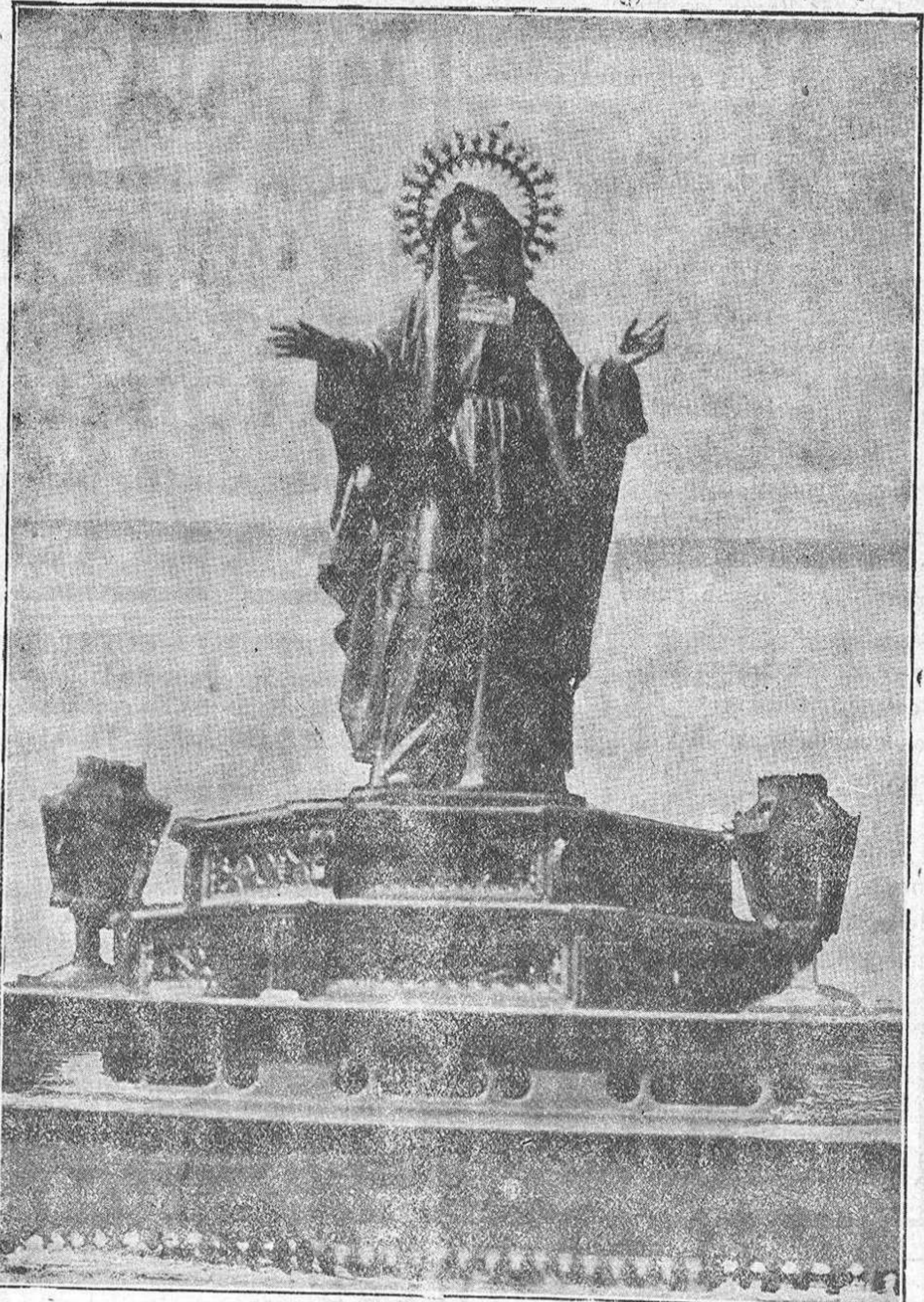
La Virgen de la Resurrección

la Horta, la procesión de la Resurrección, organizada por la cofradía de este título.