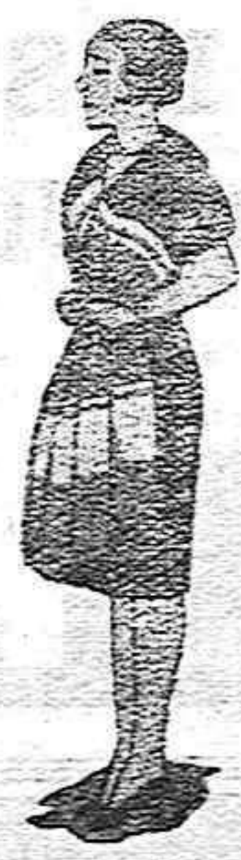
Marea de Fábrica

Exigid en todos los almacenes y establecimientos de ultramarinos finos, los productos de esta fábrica