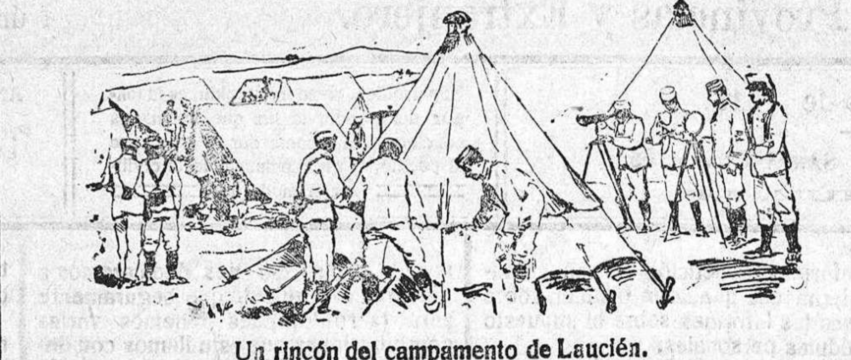
Un rincón del campamento de Laucien.