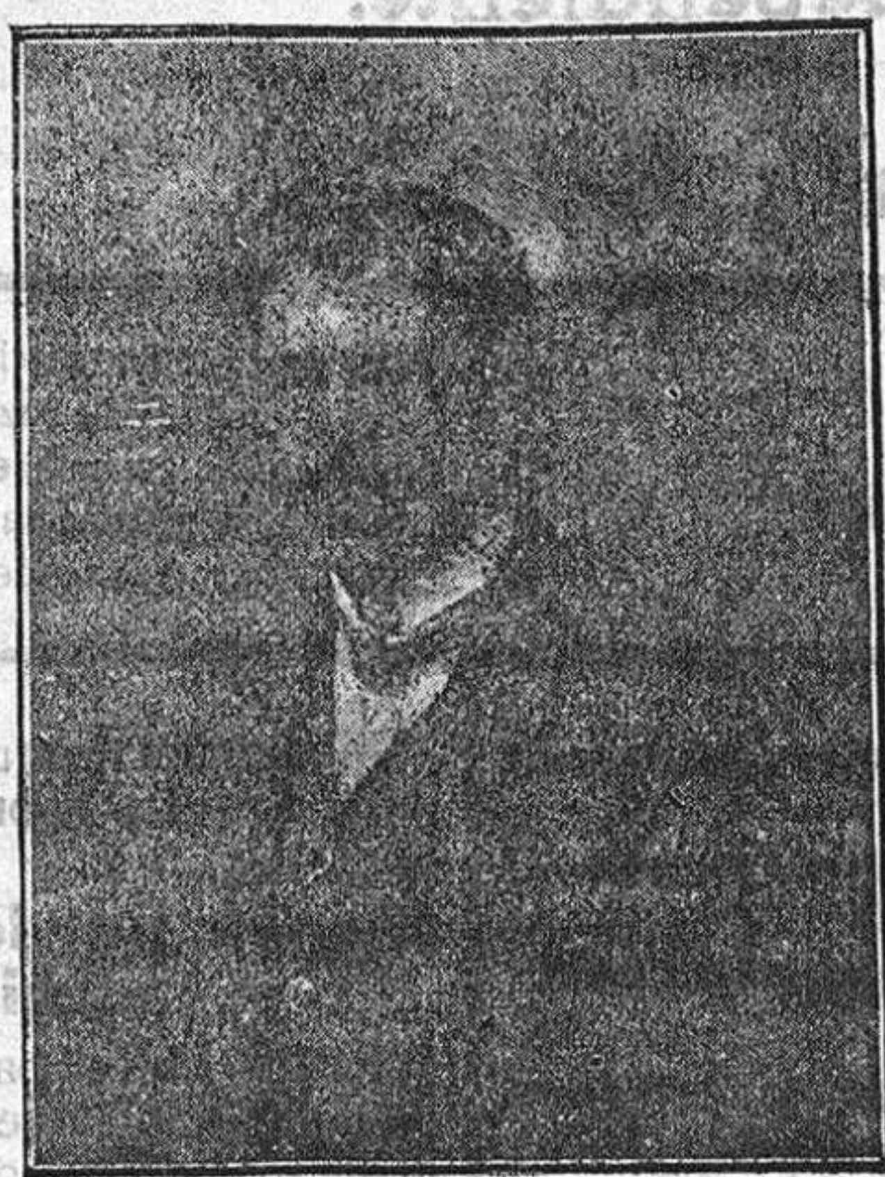
SEÑOR JULIANO, que actúa con envidiable éxito en el Cine Buenaventura, instalado en la Plaza de San Gil.