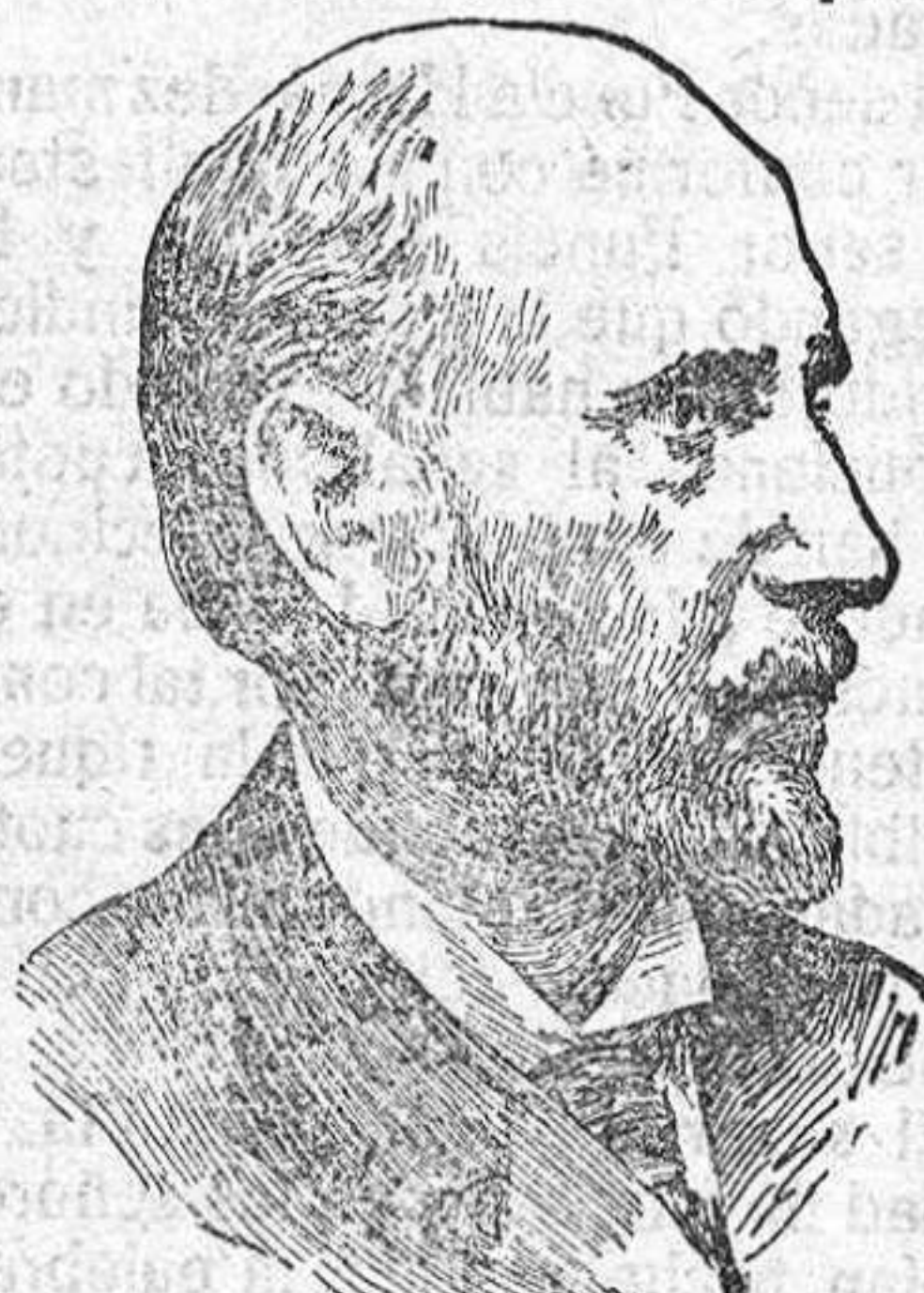
Don Santiago Ramón y Cajal.

No hubo acuerdo previo entre los opuestos elementos que figuran en la docta Sociedad respecto al candidato, y frente a la candidatura del conde de Romanones, pusieron los no políticos, los independientes, entre los que figura