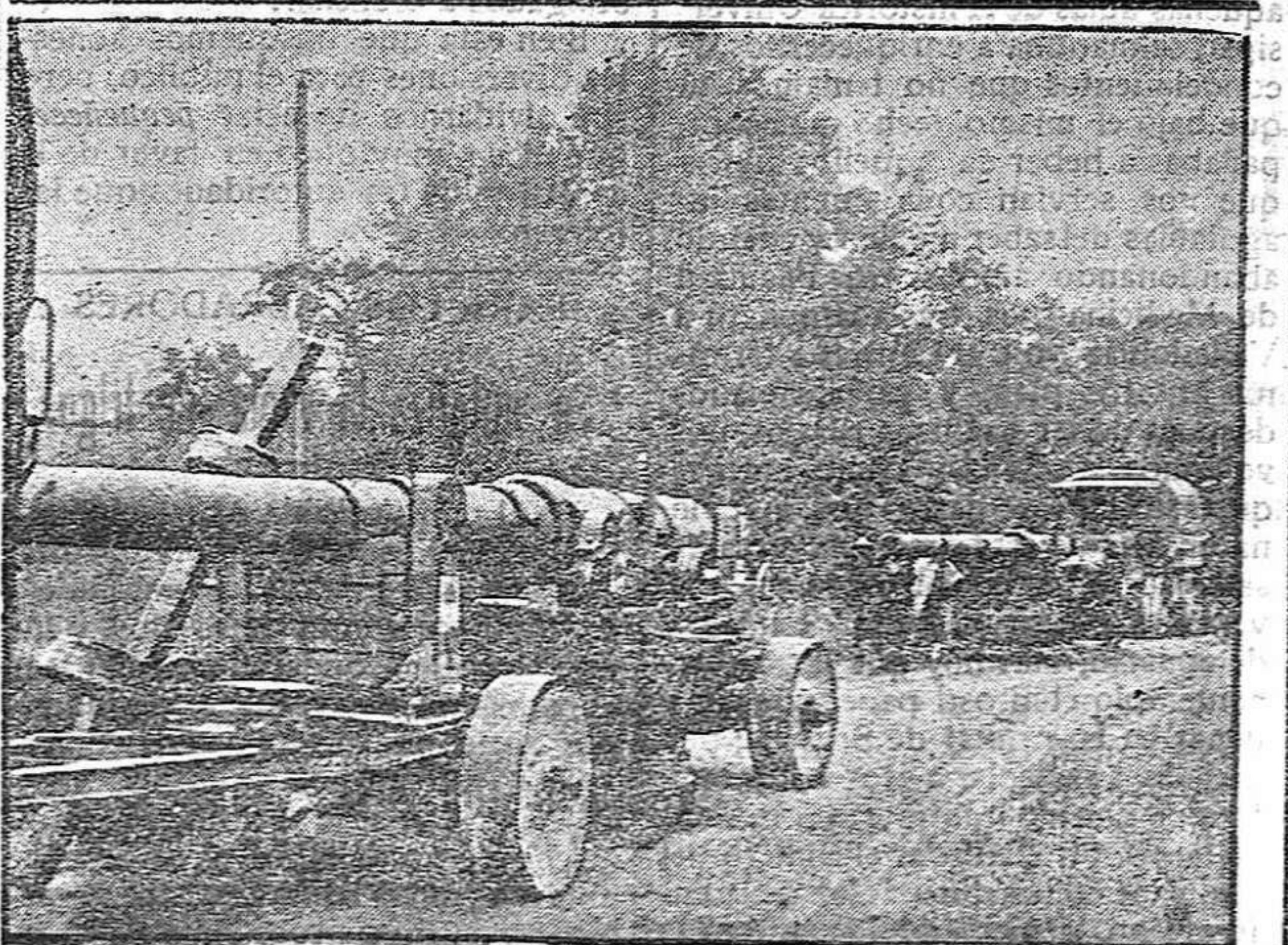
DE LA GUERRA.—Cañones de Marina en el frente francés.

Se sirve por vagones y por sacos. (Siempre existencias). Pida V.ajecios