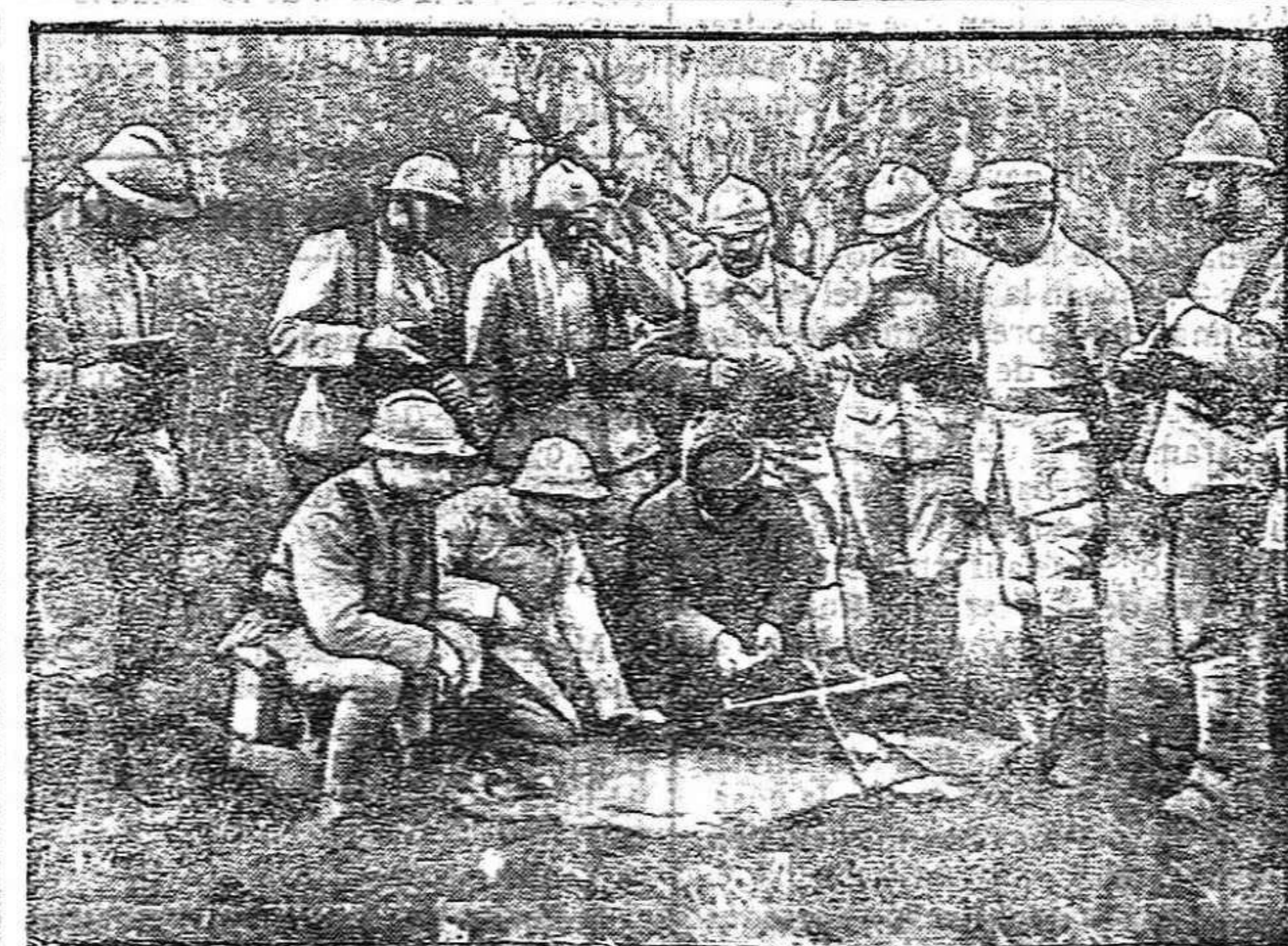
DE LA GUERRA. Enseñanza del manejo de las ametralladoras en Francia

La fiesta de la Agricultura La Sociedad Agrícola del inmediato pueblo de El Perdigon celebra hoy la fiesta de su patrono San Isidro Labrador, con varios actos de compañerismo y solidaridad que redundarán en favor de la Agricultura, desheredada de la fortuna. En su centro social, los labradores