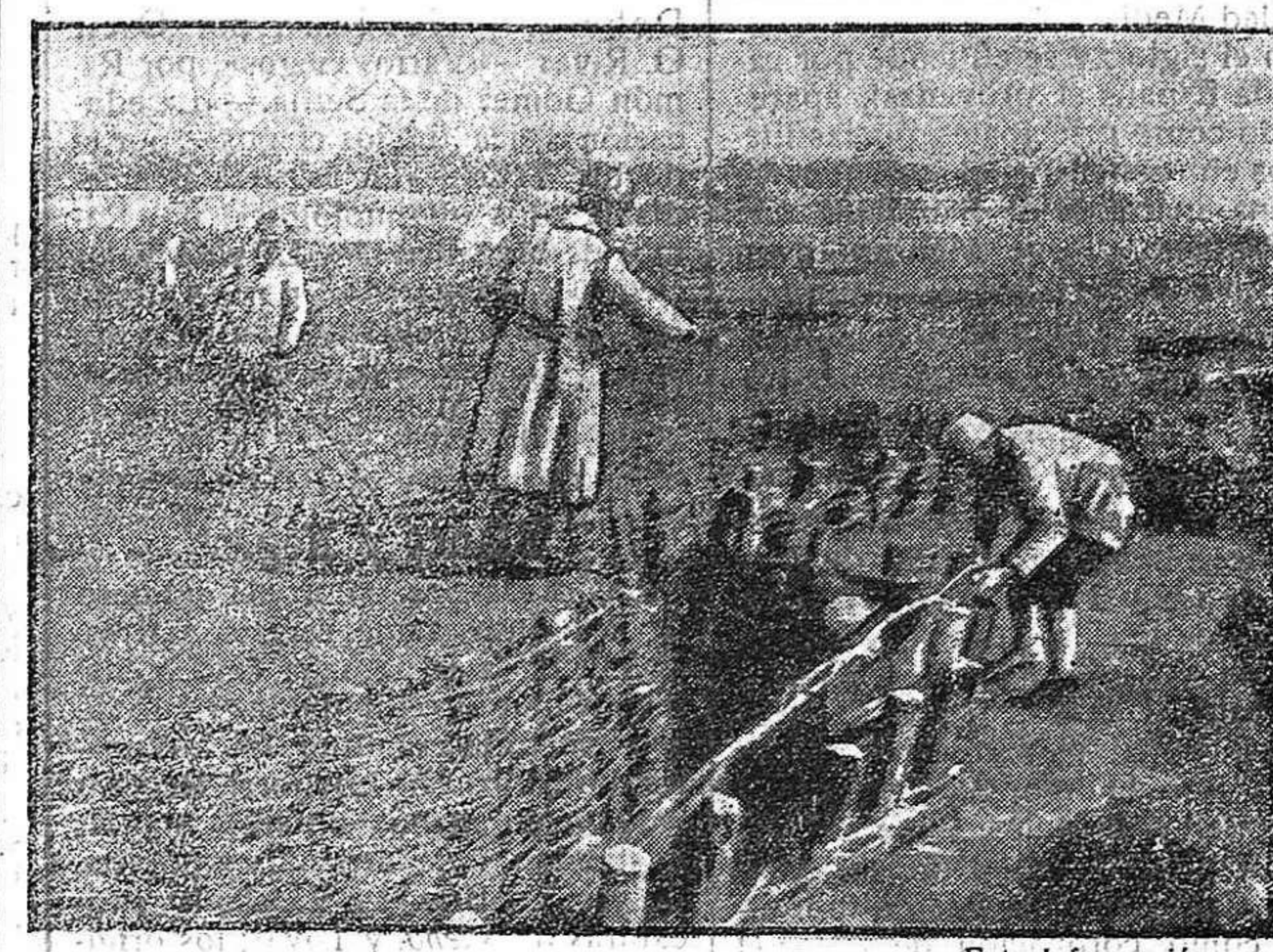
DE LA GUERRA.—Construcción de trincheras en el frente francés.

Ahora sí, el adelanto de la hora nos ha traído, como es lógico, otro adelanto que nos conviene y es que el correo llega a este pueblo con tiempo suficiente para repartirlo antes de la comida.