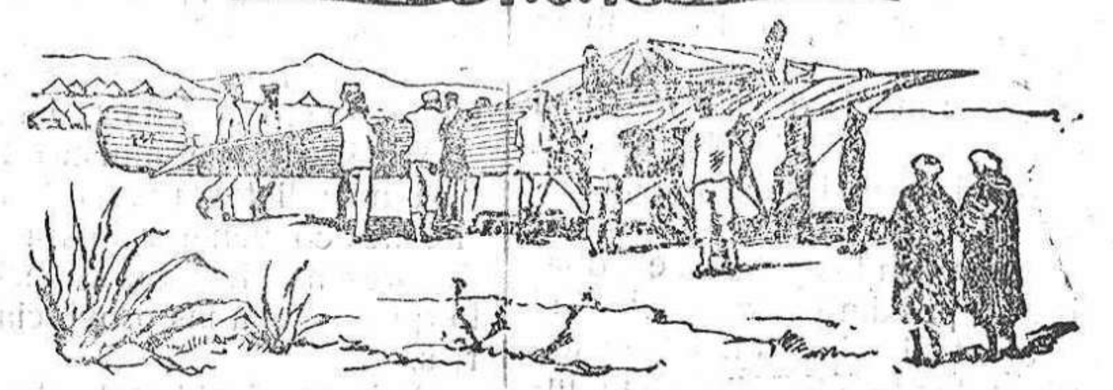
Monoplano militar disponiéndose para realizar un vuelo de prueba en el campo de aviación de Arcila.