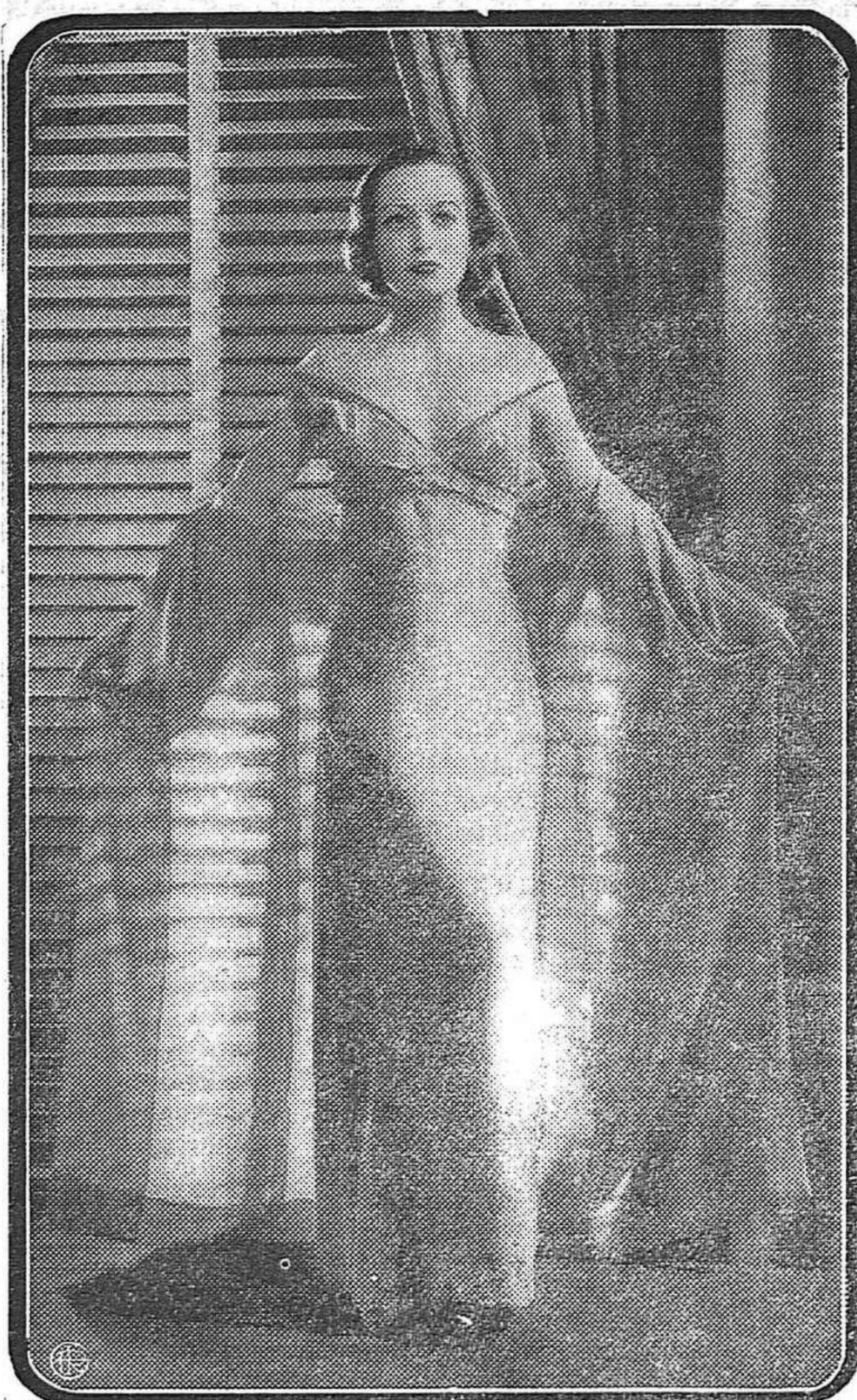
Después del clamoroso triunfo conseguido con la película «Grand Hotel» el nombre de Joan Crawford,—la bella mujer de ojos grandes y cuerpo eúrítico—vuelve a sonar como protagonista de un nuevo film, que será uno de los acontecimientos cumbres en la actual producción cinematográfica.