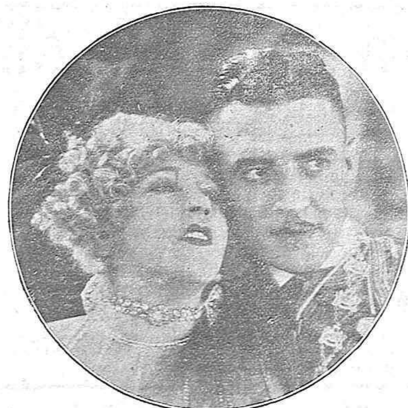
JOHN GILBERT y MAE MURRAY principales intérpretes de la película de la "Metro Goldwyn"

Y tan impresionadas quedaron las augustas personas, lo mismo de la obra que de la excelente interpretación de Janet Gaynor y Charles Farrell, que persuadieron a Su Majestad la Reina de España a asistir anoche con su acompañamiento al New Gallery, para ver "El séptimo cielo".