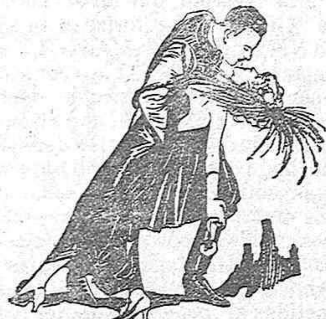
Una de las escenas de la película "La Viuda Alegre".