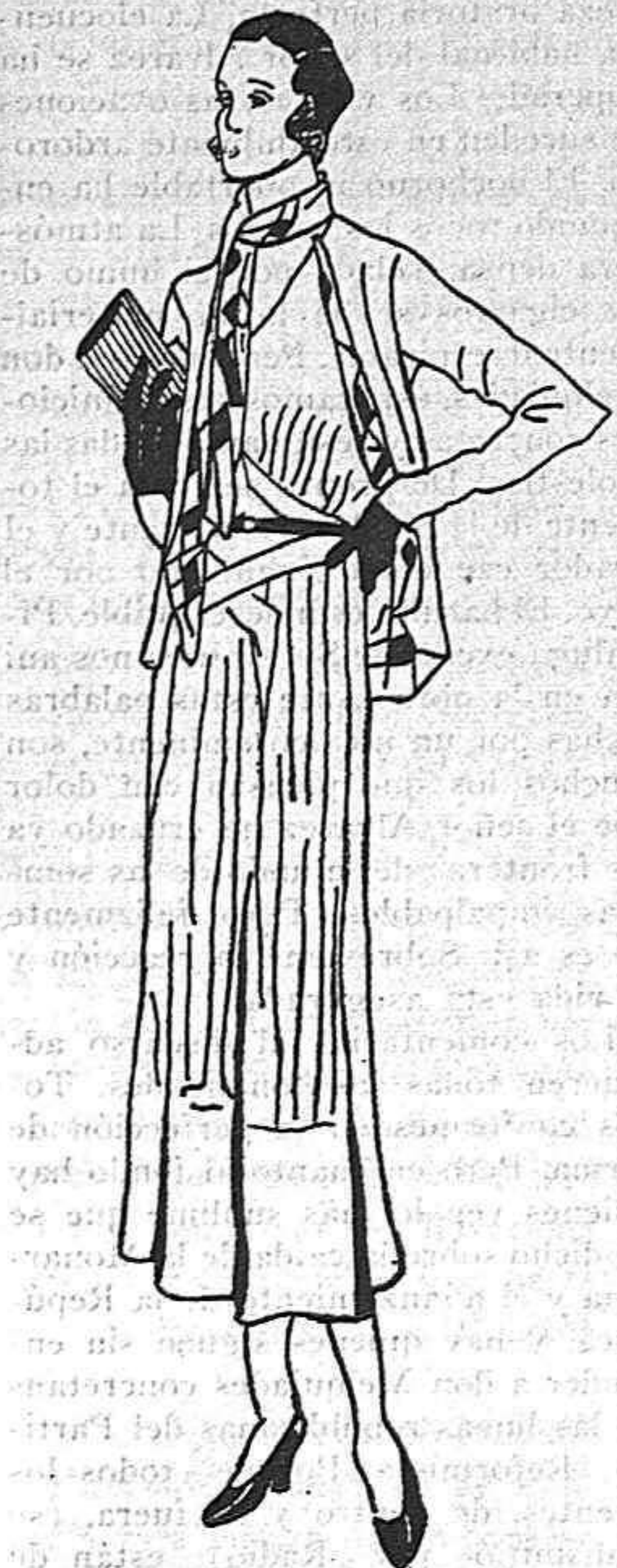
Traje de lana ligera, confeccionado con adornos en líneas verticales. Pañuelo en piqué blanco y cuadros color rosa.