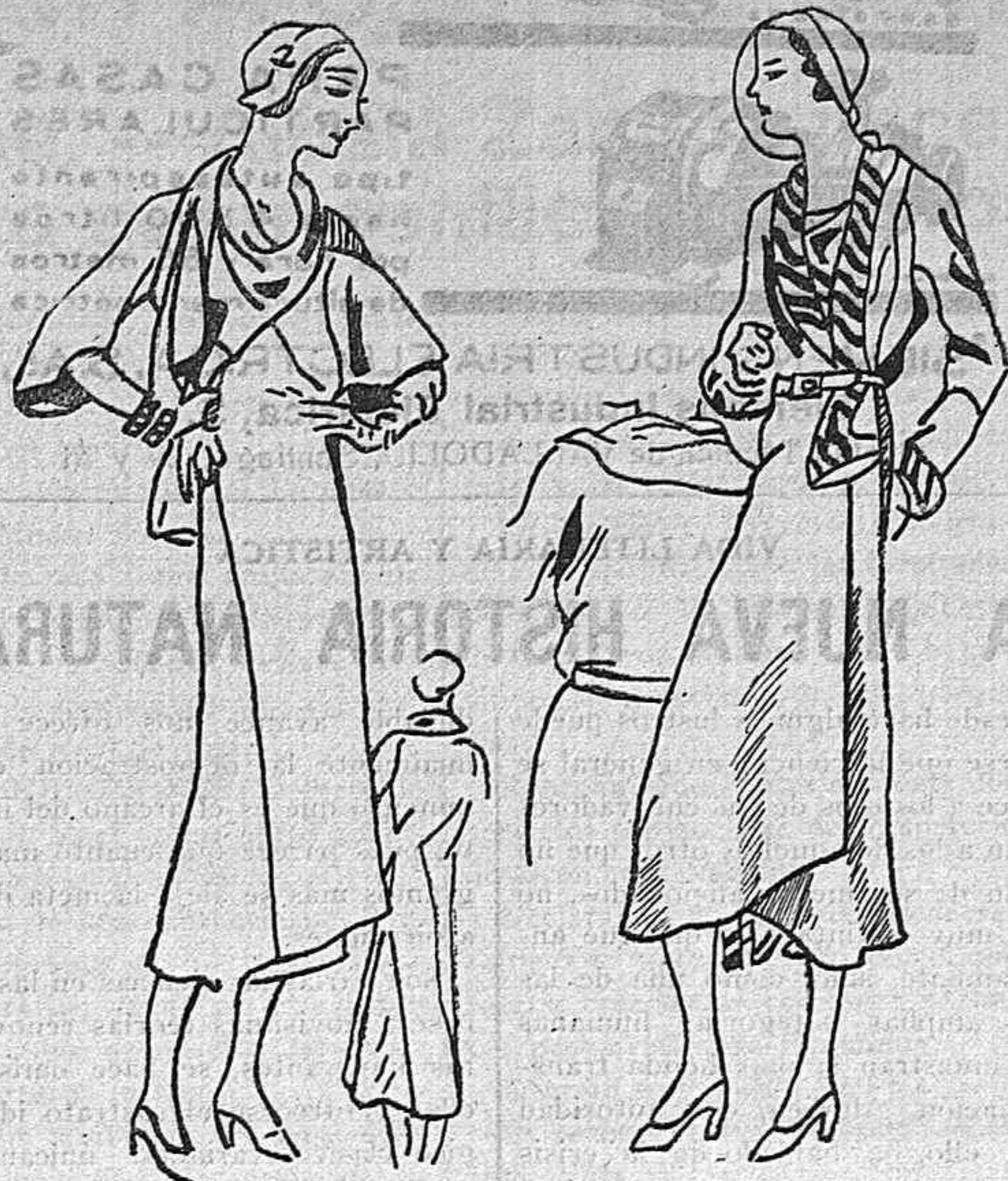
Dos trajes para jovencita, confeccionados en lana verde el de la izquierda y en «tweed» el de la derecha. Los dos lucen adornos de encajes sobre el cuello y sobre las mangas.

Ternera al tricandeau.—Ingredientes: Tres cuartos de kilo de ternera, panceta, aceitunas, un vaso de vino blanco y un limón.