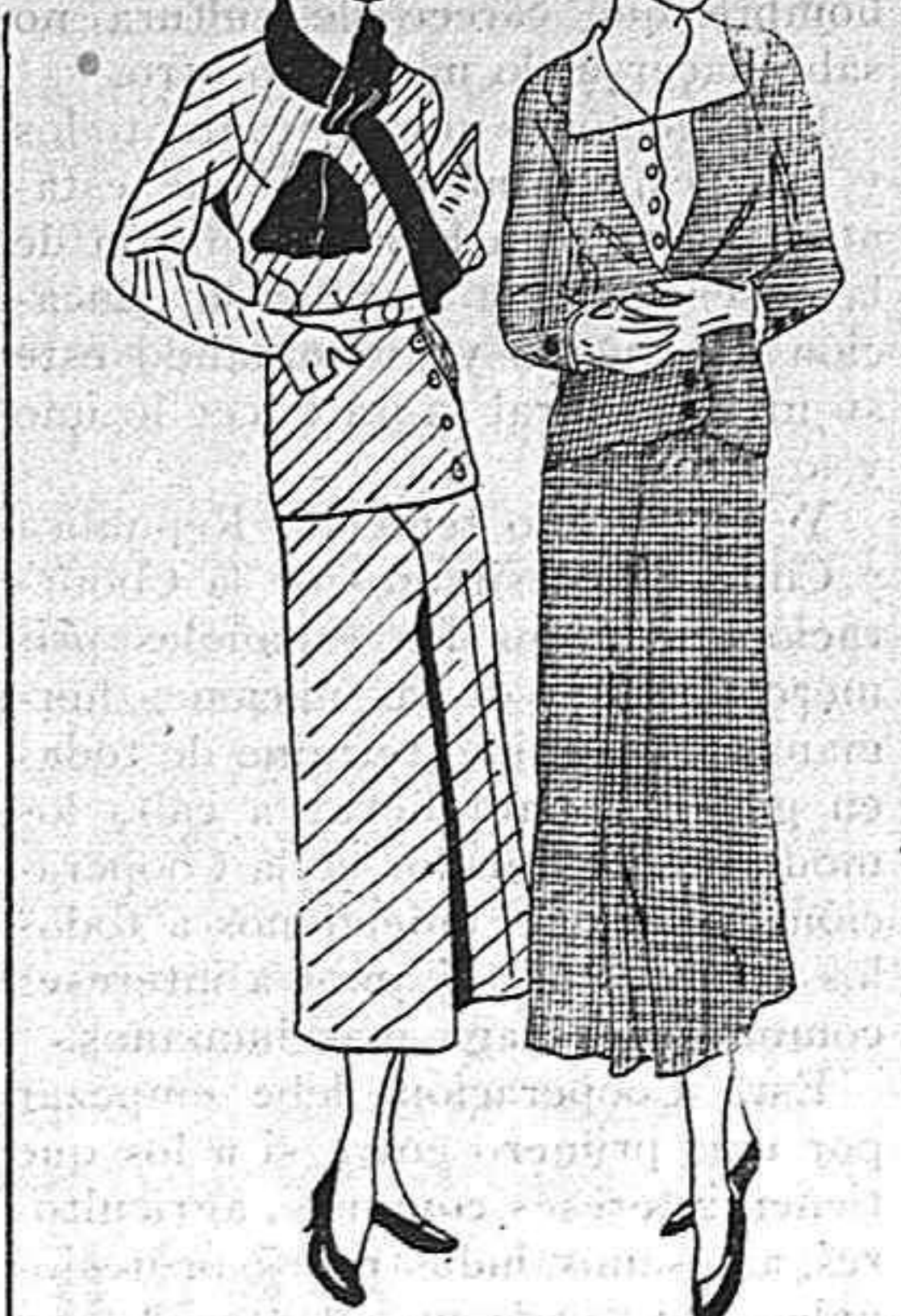
A la izquierda: Toilette de mañana. El vestido es en «tweed» a rayas diagonales beige y blancas. La chaqueta se cruza oblicuamente por botonaje.

Nosotros precindimos de ellas por creer que realmente son peligrosas en muchos casos y como pueden ser perfectamente sustituidas, de ahí nuestra decisión.