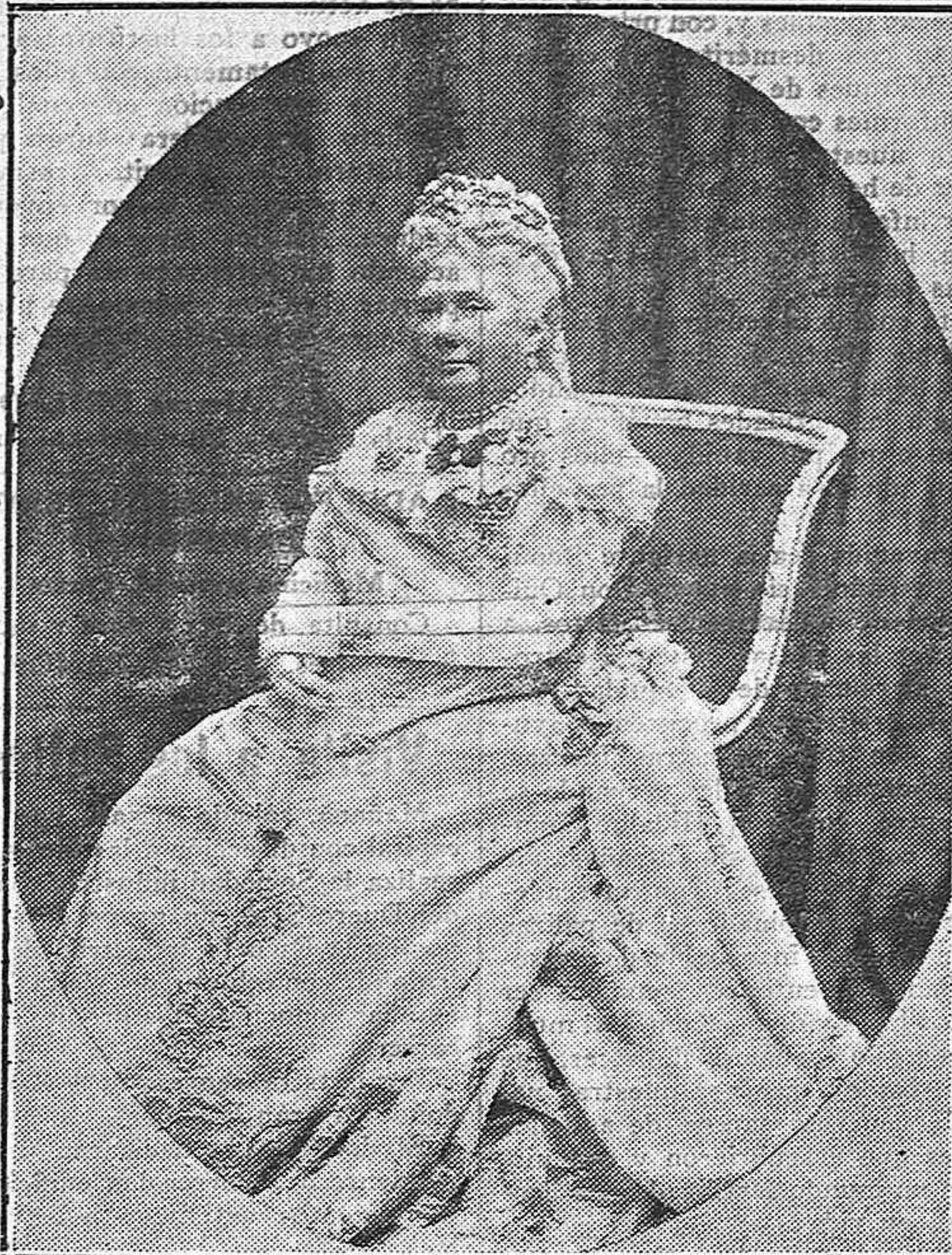
La infanta doña Isabel de Borbón, que ha fallecido ayer en París

El fallecimiento de doña Isabel, lejos de donde nació, ha de producir dolorosos sentimientos. La infanta Isabel tenía la simpatía del pueblo. No en vano era algo simbólico de