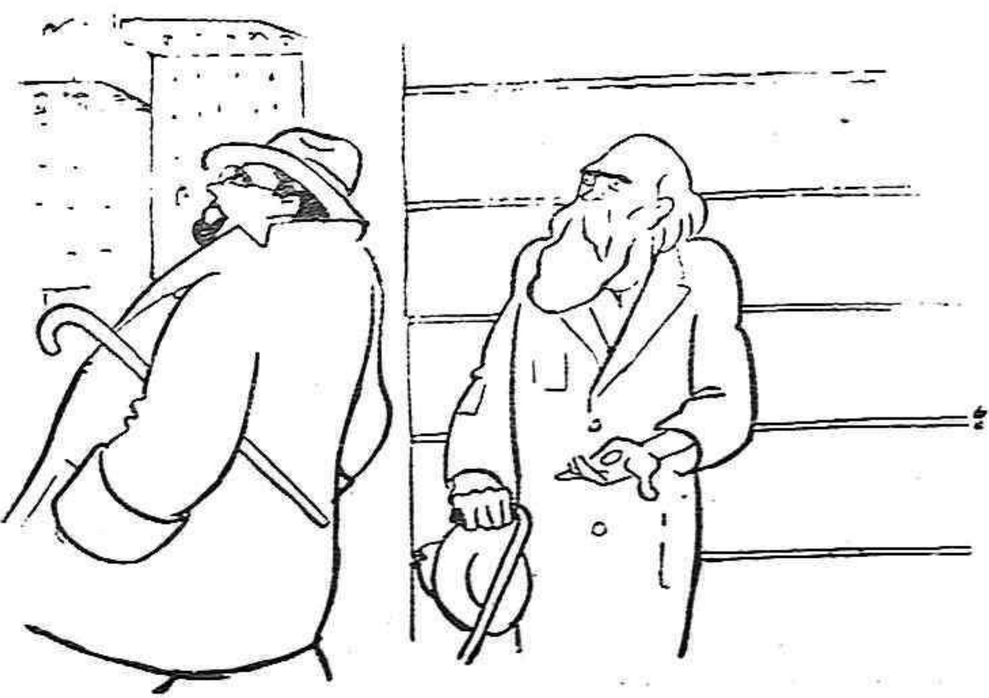
El mendigo con toda dignidad:—¿Cinco céntimos? ¿Pero es que usted me toma por una criatura?