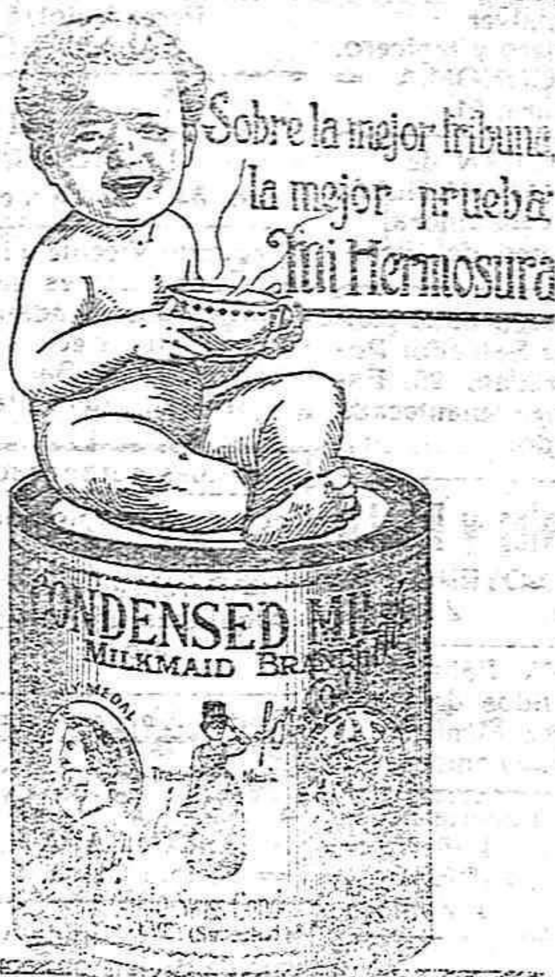
Sobre la mejor tribuna la mejor prueba es su hermosura

TRASPASASE establecimiento de vinos y comidas con anejos locales para cualquier negocio, San Pablo, núm. 8.