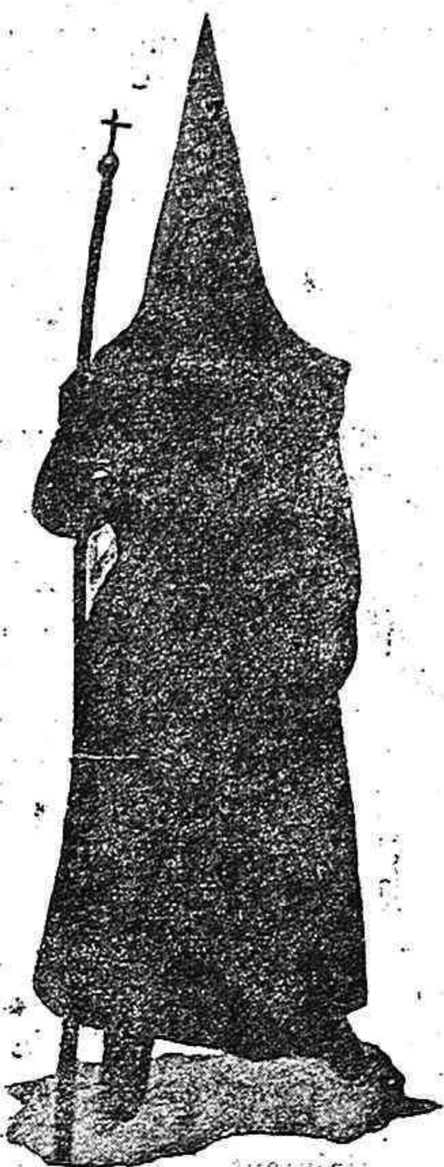
Hermano de la Vera Cruz

En las primeras horas de la mañana del Jueves Santo, se empieza a vivir de lleno la celebración de la Semana Santa en Zamora.