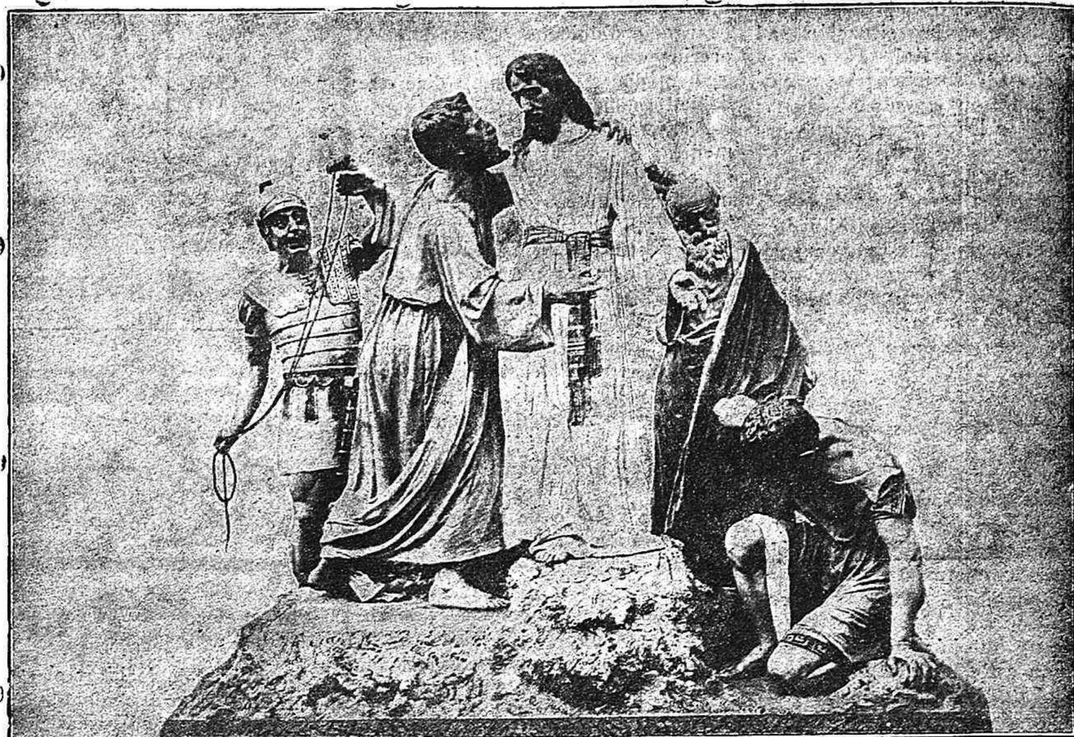
EL BESO DE JUDAS