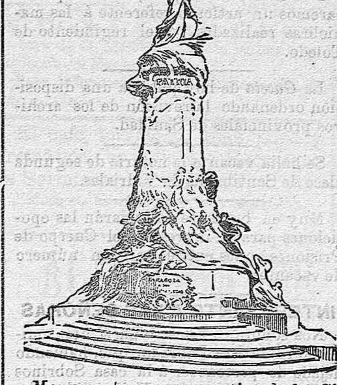
Monumento conmemorativo de los Sitios de Zaragoza, inaugurado ayer.