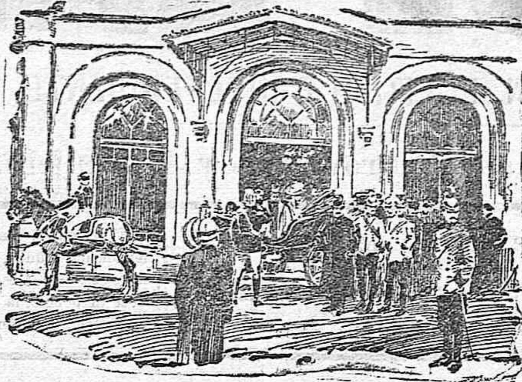
SS. MM. en Viena LOS REYES SALIENDO DE LA ESTACION DEL NORTE.