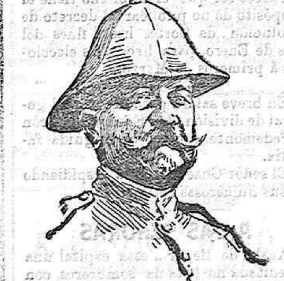
Don Federico Santa Coloma. Coronel del regimiento de León.

Ha causado aquí viva sorpresa este inesperado ataque de nuestros vecinos, sobre todo en este momento en que están realizándose con visos de feliz resultado, gestiones para la terminación de las hostilidades, siendo la actitud del comandante militar, en esta ocasión, objeto de general alabanza por parte de los emisarios moros.