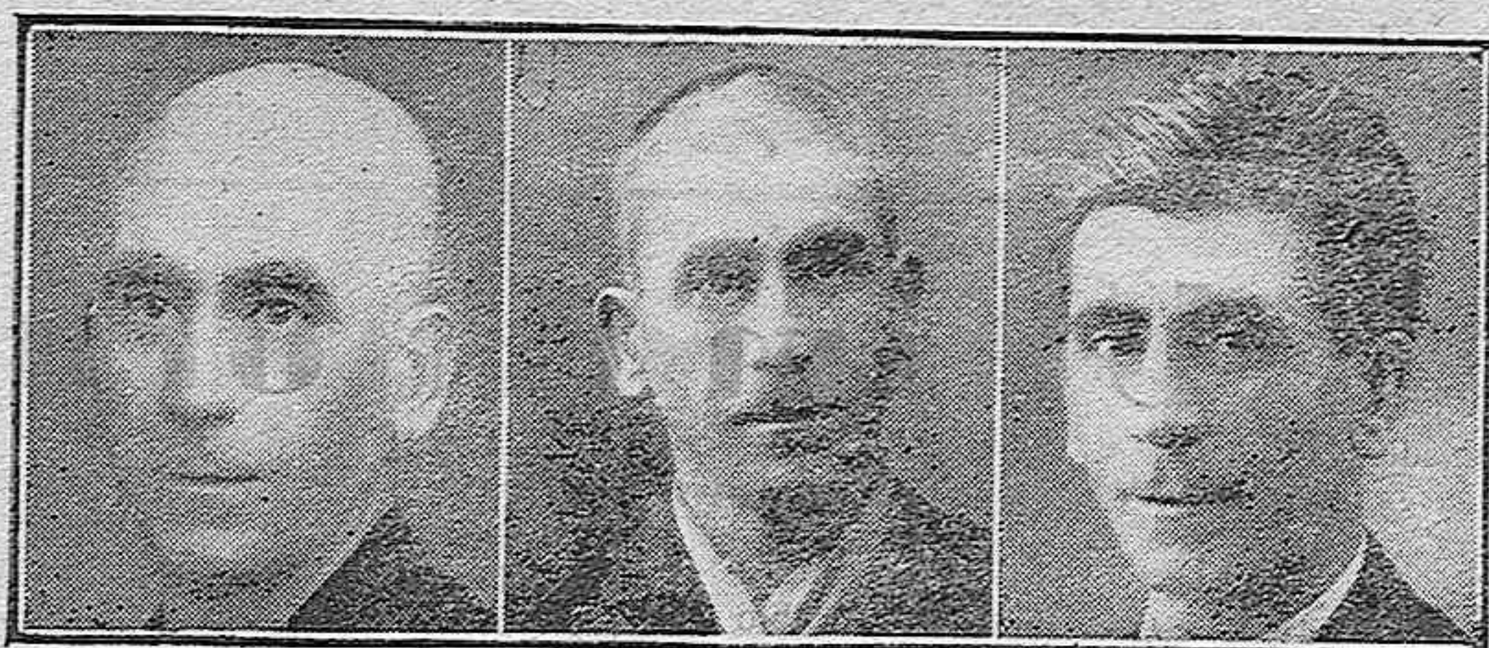
OCHO AÑOS CALVO - CURADO EN OCHO MESES