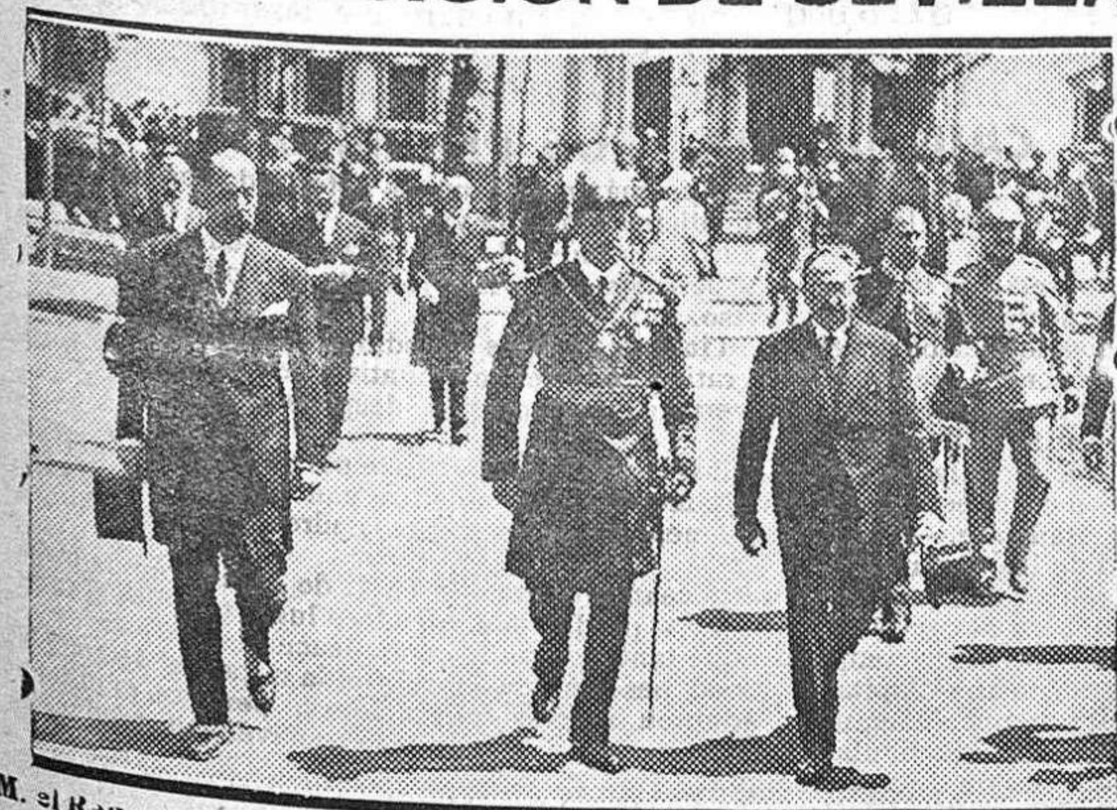
S. M. el Rey, en unión del representante de Bolivia y del director de la Exposición, a la salida del pabellón de dicho país.