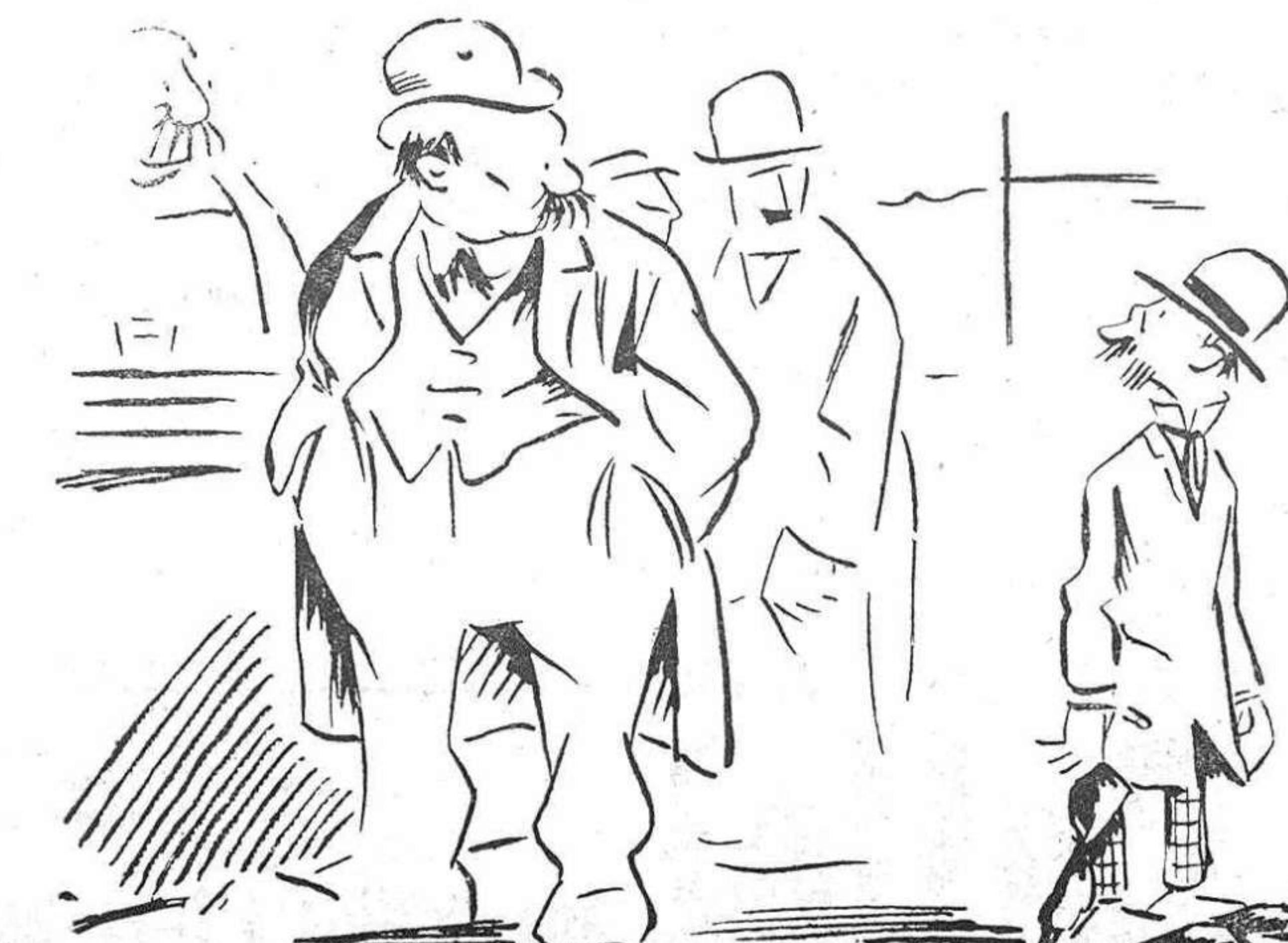
El hombre pequeño.—¿Qué? ¿Se figura usted que le tengo miedo? ¡Ya verá usted como llamo a un guardia!