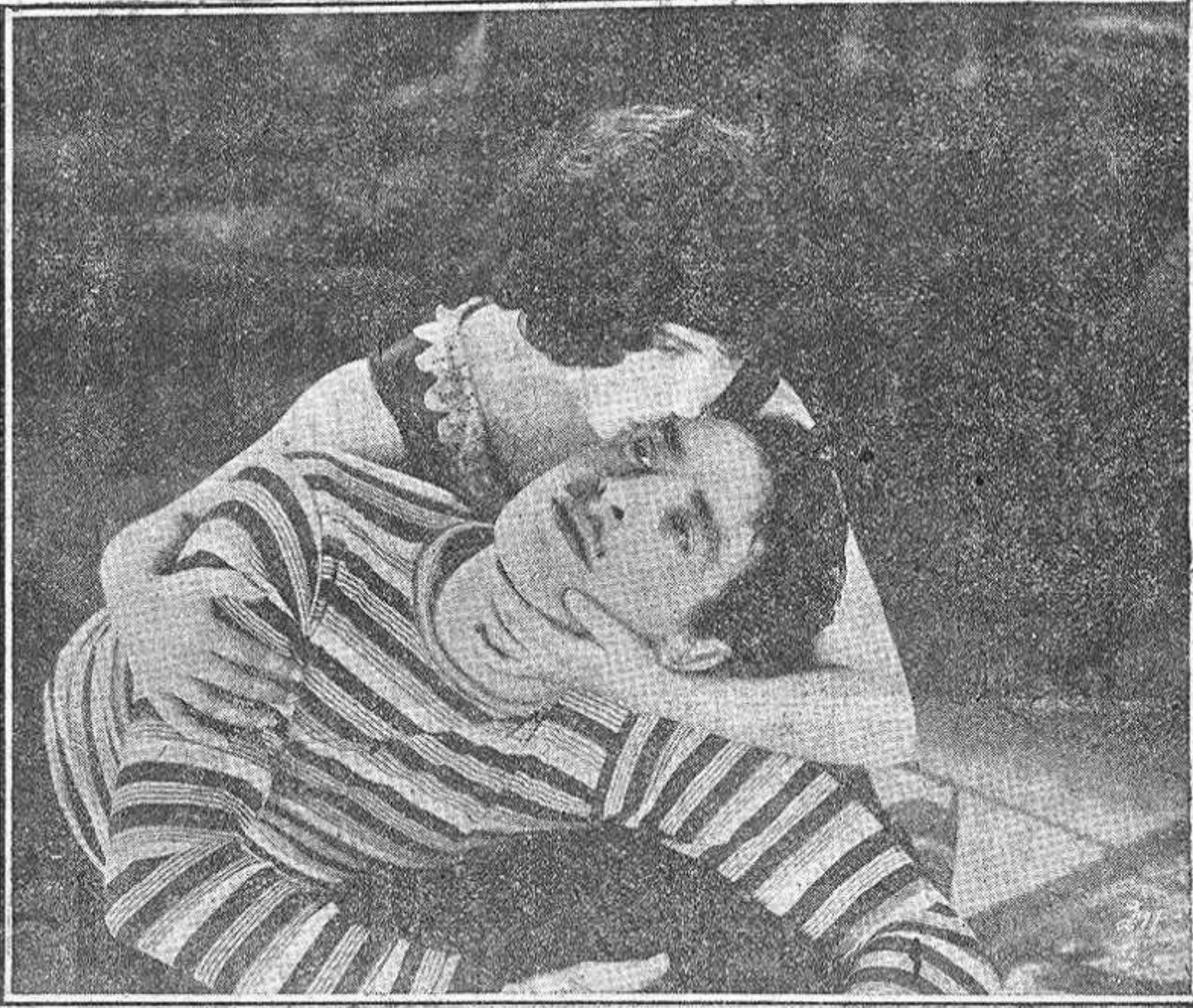
Una escena de la gran producción "Metro" EL PALACIO DE LAS MARAVILLAS, que se estrena hoy en el Teatro Principal.

El estreno de "Moulin Rouge" Para los verdaderos amantes del cine de vanguardia el estreno de "Moulin Rouge" constituye el más poderoso atractivo de la actual temporada. Saben estos que el genial director de "Varietés", E. A. Dupont, ha de superar la belleza plástica que consiguió en los estudios de la "Ufa" al componer la citada obra. Esperan, por otra parte, toda la fantasía que Dupont ha vertido en esta obra de la manufactura británica.