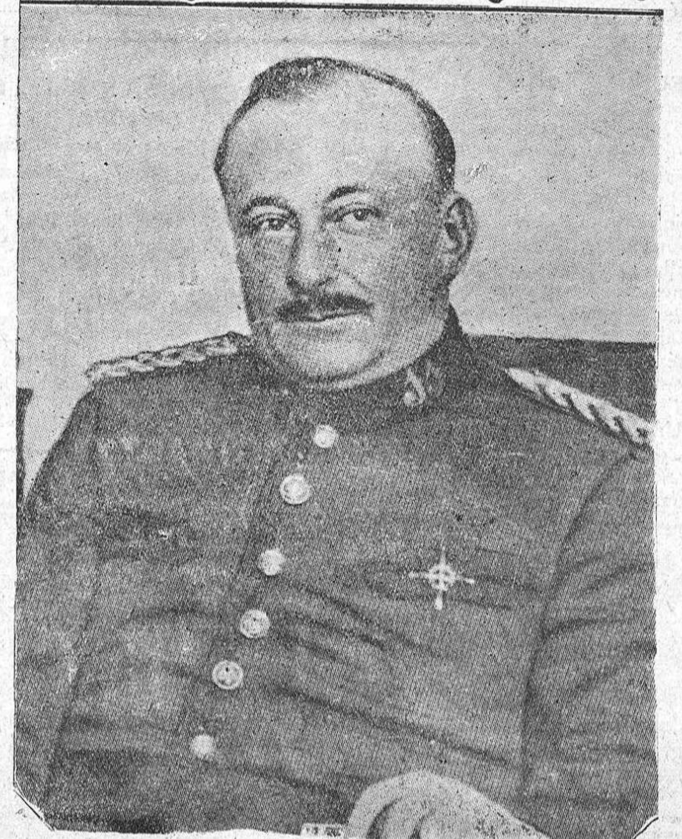
Excelentísimo señor don Miguel Primo de Rivera marqués de Estella, exjefe del Directorio Militar y de Gobierno de la Dictadura que falleció ayer en París