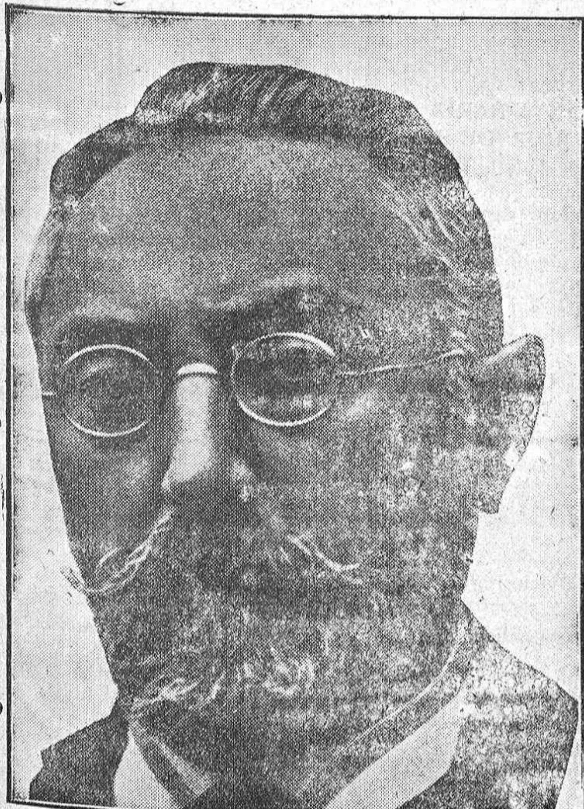
El sabio don Miguel de Unamuno que honra hoy con su visita a Zamora, con motivo del estreno en el Teatro Principal de la obra “Sombras de Sueño”