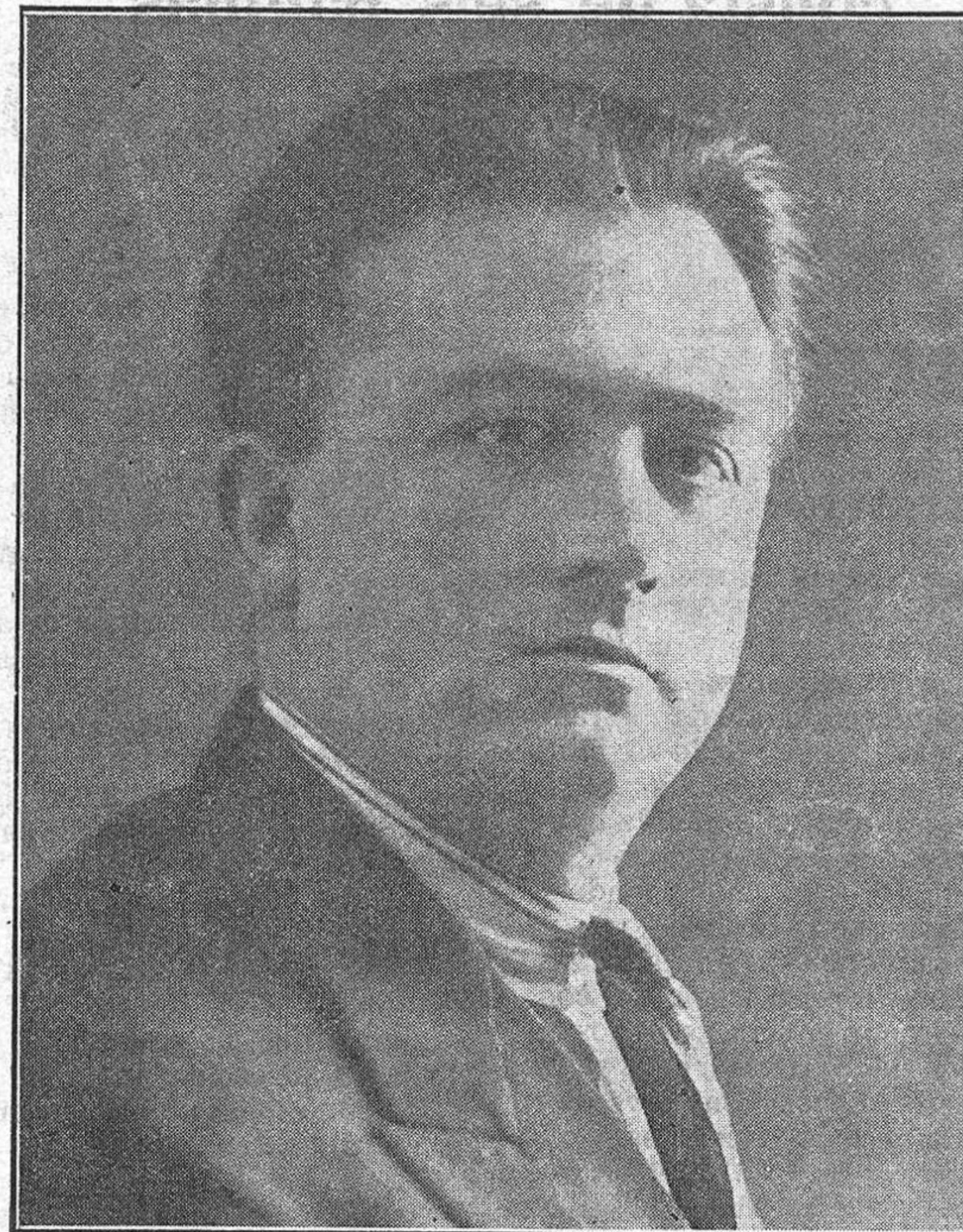
VICENTE SEMPERE, eminente tenor que tomó parte en el concierto de la Real Coral, alcanzando un éxito insuperable.

ron en el teatro de la calle de Ramos Carrión para presenciar el estupendo concierto organizado por la Coral.