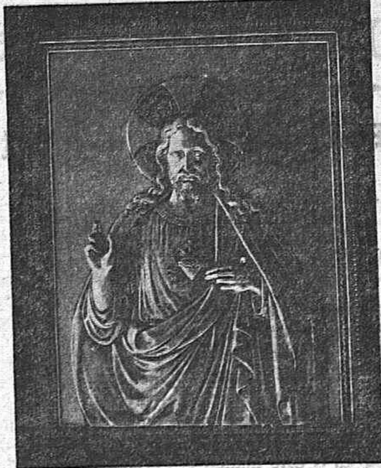
Reproducción del Sagrado Corazón de Jesús, obra de un notable escultor alemán.

ralmente el hecho de que ahora se producen en España, ha beneficiado no sólo al comprador, que paga la mitad de lo que pagaba antes, sino también al comerciante, que encuentra mejor salida para la mercancía al hacerla asequible a un público, al que antes no podía llegar.