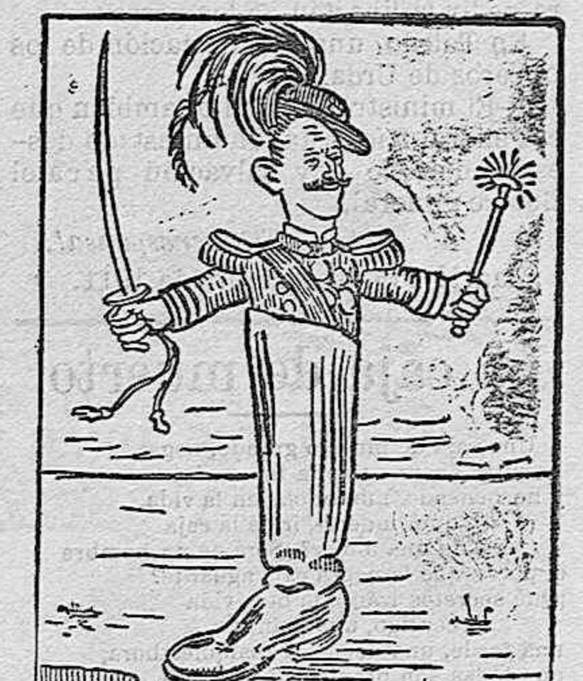
El gran Pachá de la Tripolitana, Víctor Manuel III. (De Fantasio).