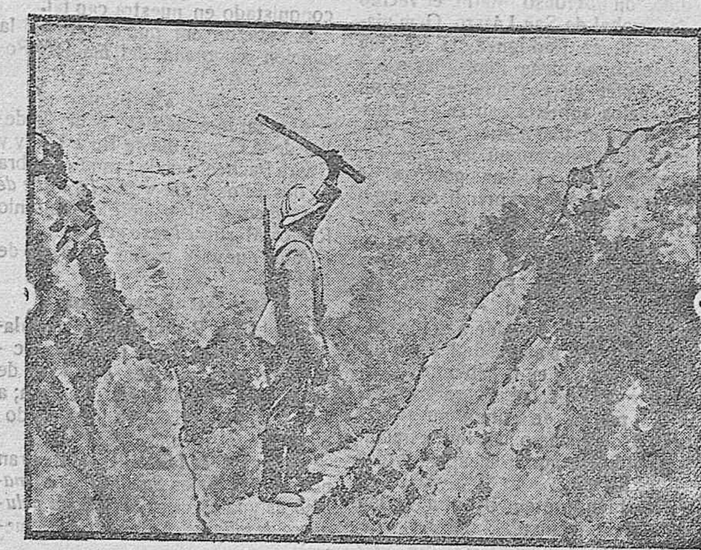
DE LA GUERRA.—Alambrada en una antigua trinchera alemana.