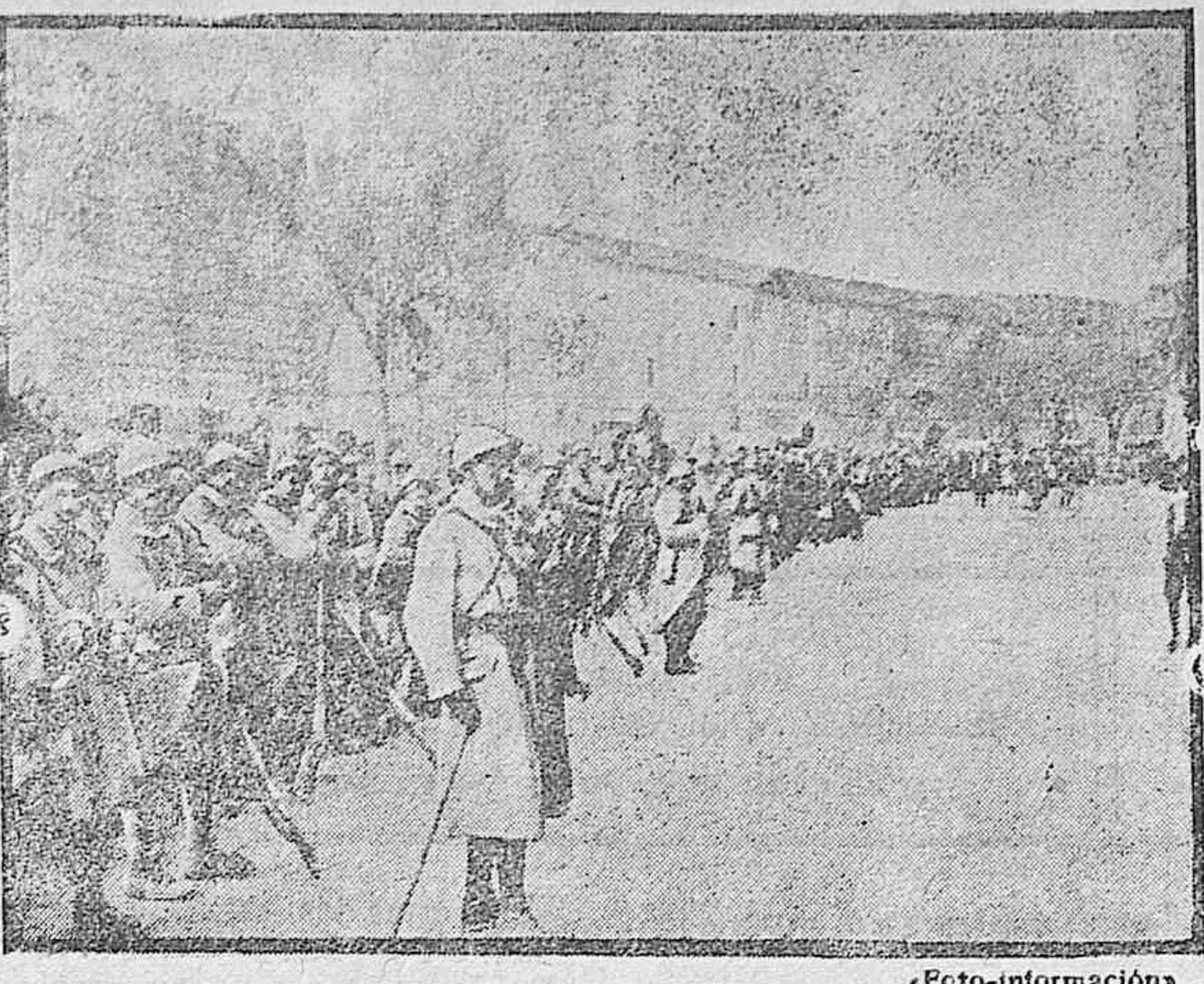
DE LA GUERRA.—Tropas francesas en Verona.