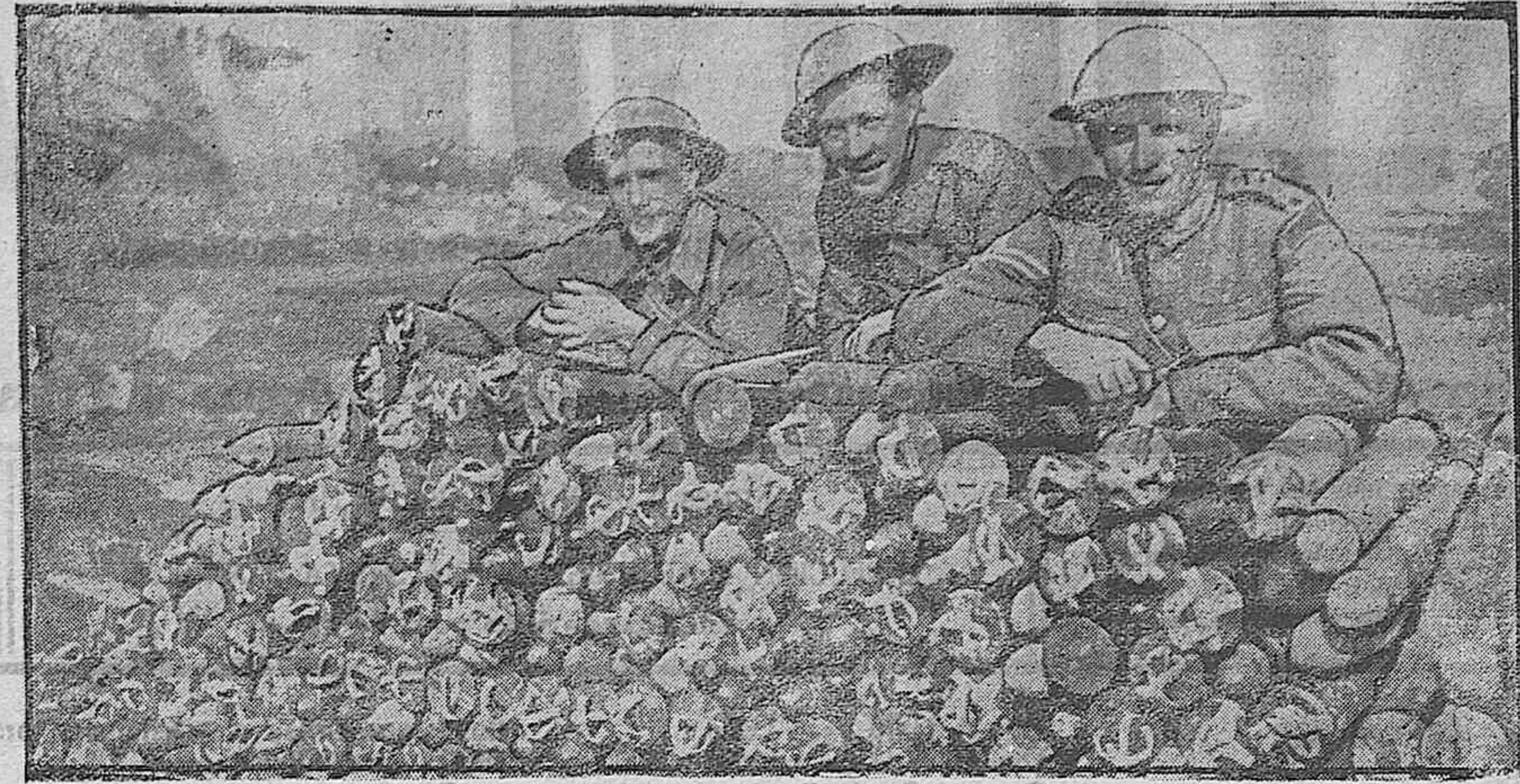
DE LA GUERRA.—Artilerros y municiones inglesas.

En Zamora: Trigo a 70 reales lanega. Sebada, a 54. Algarrobas, a 51. Guisantes a 60. Abotes a 59. Harinas.—Extra a 21,25 reales arrobel 1.º clase a 20,75 y de todo pan a 20,25. En Valladolid, día 4. Mercado del Canal.—Las entradas de trigo al detall en este mercado fueron hoy unas 250 fanegas que se pagaron a 74,50 reales las 94 libras.—Pesetas 43,07 los 100 kilos. Tendencia firme en los precios. Mercado del Aree.—Las entradas de trigo en este mercado del detall, fueron unas 350 fanegas de clase buena y superior que se pagaron a 74,50 y 75 las 94 libras.—Pesetas 43,36 los 100 kilos. También se vendieron unas 100 fanegas de trigo corriente a 74 y 74,50 reales reales las 94 libras.—pesetas 43,07 y 43,36 los 100 kilos. El trigo de clase corriente se pagó a 74 reales las 94 libras.—pesetas 42,78 los 100 kilos. Los precios continúan firmes. Mercado de pimientos.—En los mercados de esta capital se pagan estos granos al detall, a los precios siguientes: Pimiento a 56 reales las 94 libras. Sebada a 48,50 las 70. Avena a 34 los 25 kilos.