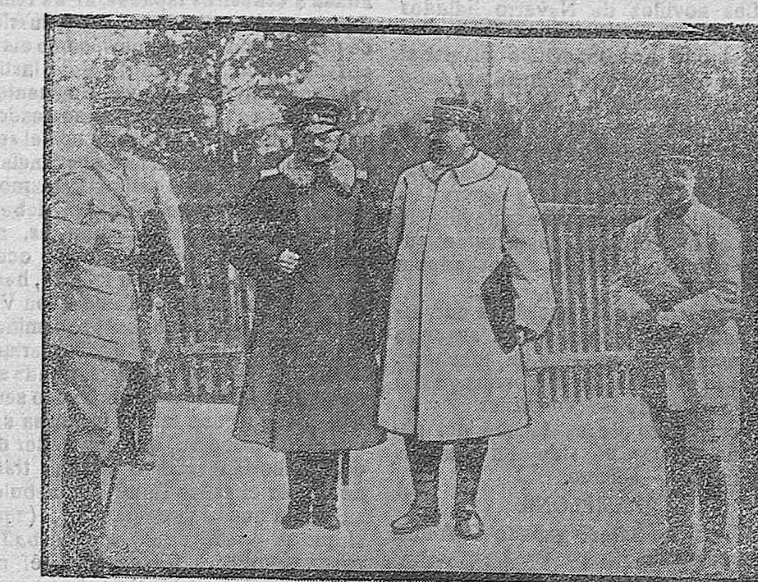
«Foto-información» Los generales Berthelot y Rebatiff saleado del Cuartel General del Ejército rumano.

El sábado por la tarde compareció nuestro director para prestar declaración acerca de la publicación en este periódico el día 29 del pasado, de una