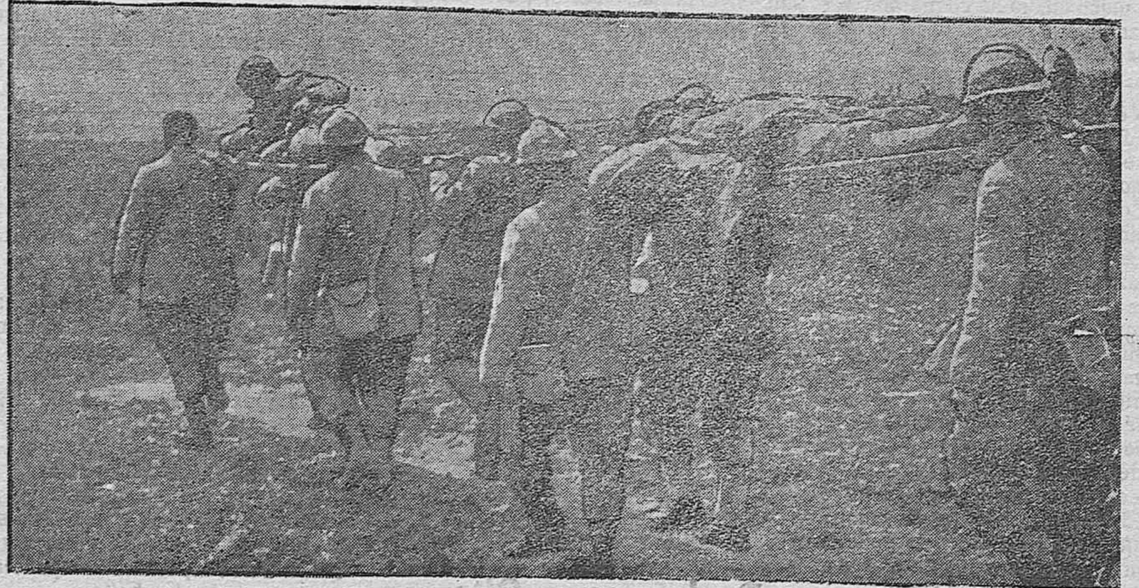
ESCENAS DE LA GUERRA.—Camilleros franceses conduciendo heridos.

Los norteamericanos comienzan a enviar a los mares europeos flotillas de buques ligeros destinados a la persecución de los sumergibles del Kaiser. Además, han botado ya al agua—y está terminado—el primero de sus contrasubmarinos. Trátase de una especie de destructor sumergible, dotado de cañones y tubos lanzatorpedos, y que dispone de aparatos de centésima invención que le permiten advertir la presencia y posición de un submarino mucho antes de que éste aparezca en la superficie de las aguas. A juzgar por las noticias que llegan de Nueva York, los ensayos han sido concluyentes y los norteamericanos se proponen sembrar el Atlántico de barquitos de esa naturaleza. El primero de ellos fué acabado en tres semanas. Hay que hacer notar igualmente que