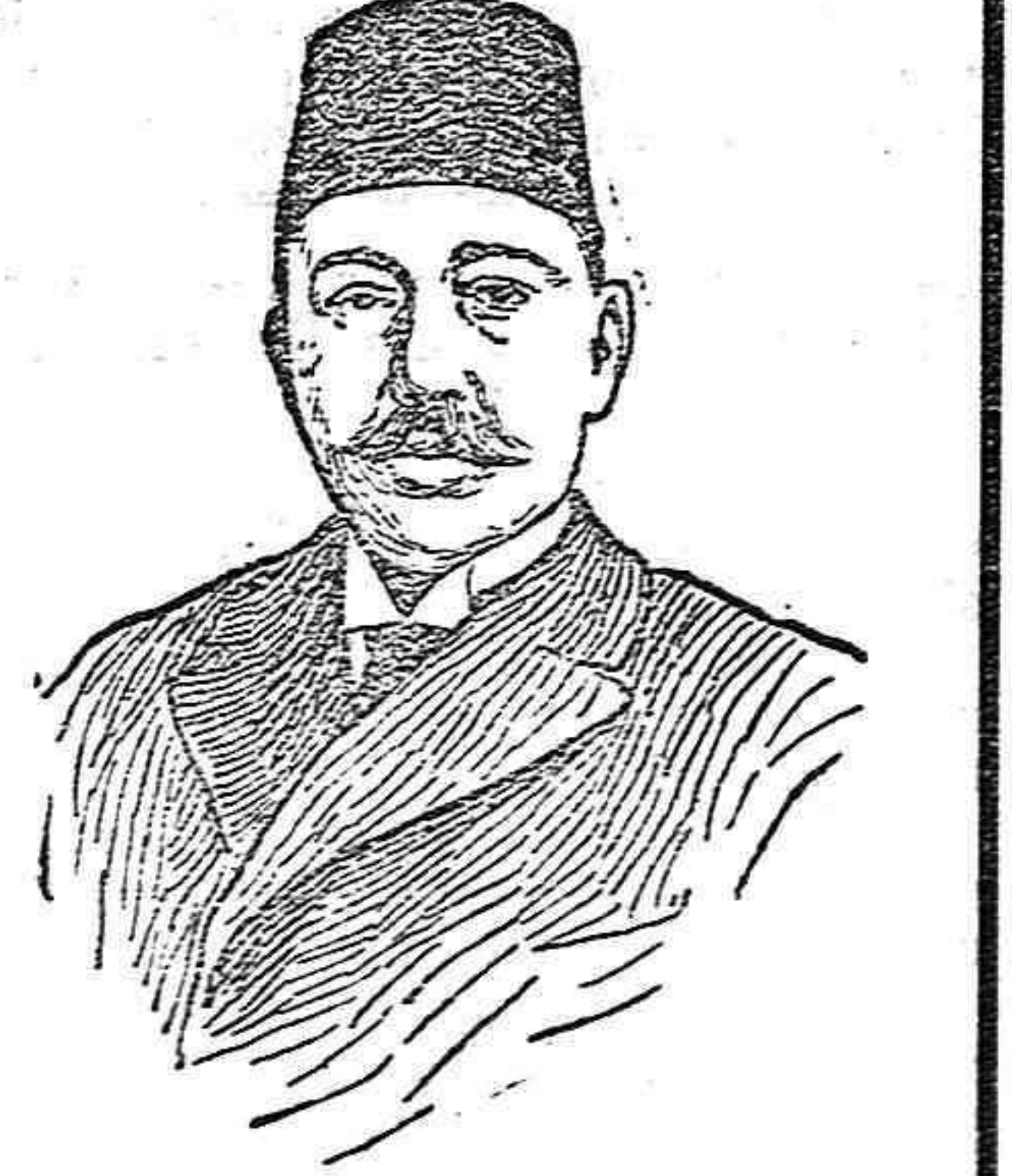
Mohamed V, sultán de Turquía.

tos turcos de la frontera y poniendo sitio a la ciudad de Daraise. Tiénesse como cosa descontada, que de un momento a otro intervendrán en la lucha Bulgaria, Servia y Grecia. Ya estalló, pues, la tan temida conflagración balcánica; ya corre de nuevo la sangre en esos desgraciados pueblos