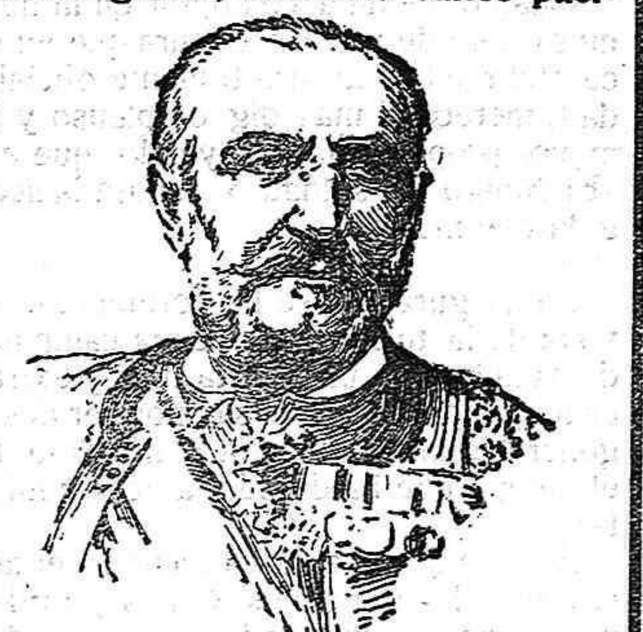
Nicolás I de Montenegro.

Las oposiciones a escuelas anunciadas por el Rectorado de Salamanca, tanto las de maestras como las de maes-