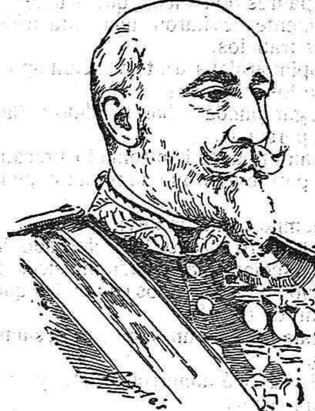
El teniente general don Angel Aznar, nombrado director de la Guardia civil.

Las inmejorables condiciones de esa publicación unido á su baratura de tres pesetas tomo, facilita la creación de una escogida biblioteca á los aficionados que sin duda alguna dispensarán la acogida que se merecen á los volúmenes editados por la artística Casa de la que es alma el ilustre literato don Francisco Acebal.