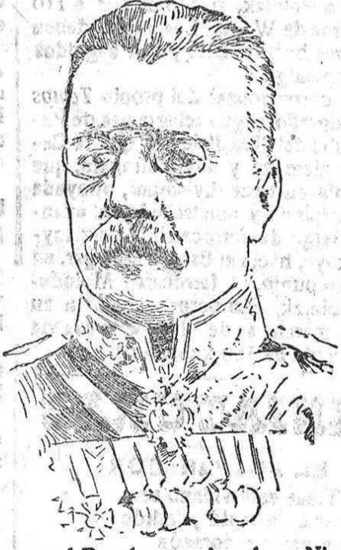
El general Rousky, a quien el zar Nicolás II ha nombrado su ayudante y jefe del Estado Mayor, en virtud de lo cual es jefe efectivo de los ejércitos rusos.