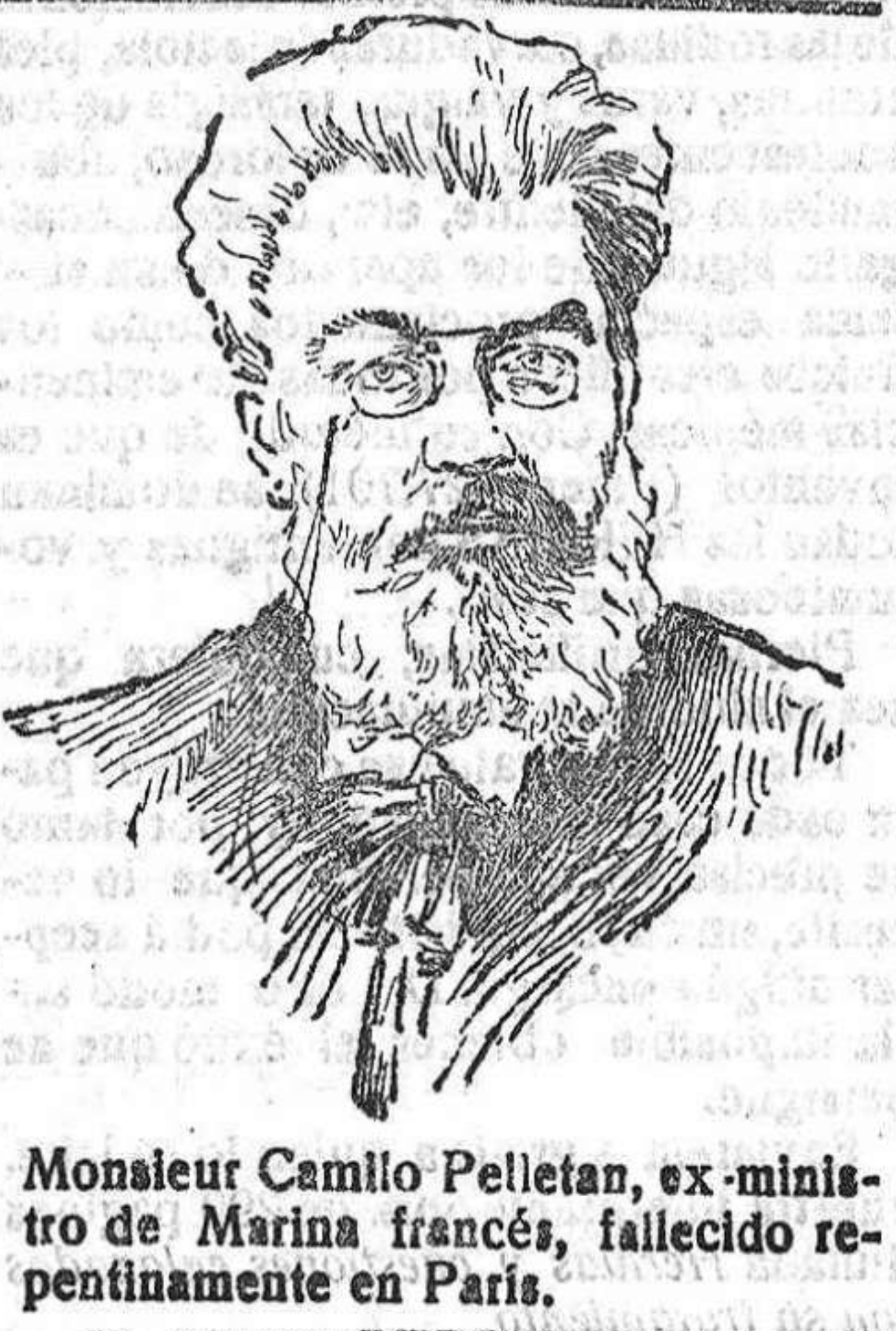
Monsieur Camilo Pelletan, ex-ministro de Marina francés, fallecido repentinamente en París.

La tropa pasará todo el día en el campo, dedicada a ejercicio de instrucción.